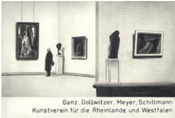
Zonder titel, 2005 Potlood, papier, 19 x 28 cm