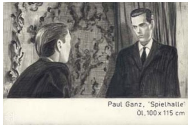
Zonder titel, 2005 Potlood, papier, 19 x 28 cm