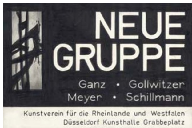
Zonder titel, 2005 Potlood, papier, 19 x 28 cm