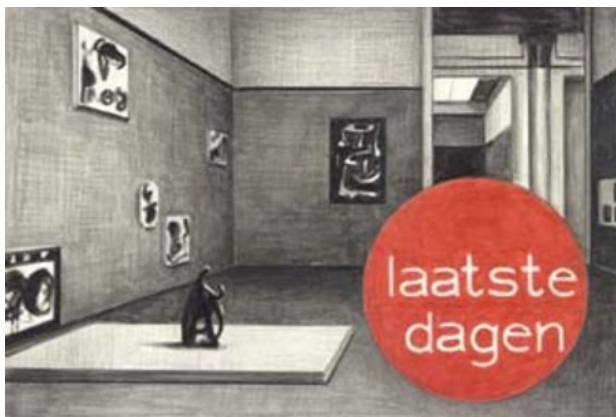
Zonder titel, 2005 Potlood, papier, 19 x 28 cm