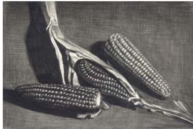
Zonder titel, 2005 Potlood, papier, 19 x 28 cm