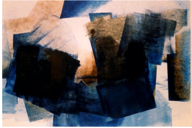
Antarctica, 1996 Monoprint, 50 x 60cm