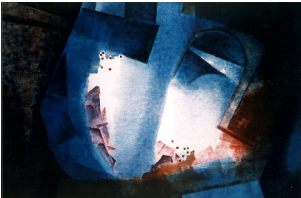
Antarctica, 1996 Monoprint, 50 x 60 cm