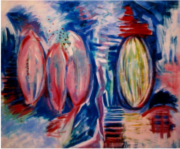
Horizontaal verticaal, 1998 olieverf op linnen, 60 x 70 cm