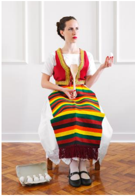
The Other Side of Reality, 2024 fine art fotografie, 60 x 40 cm / 100 x 70 cm