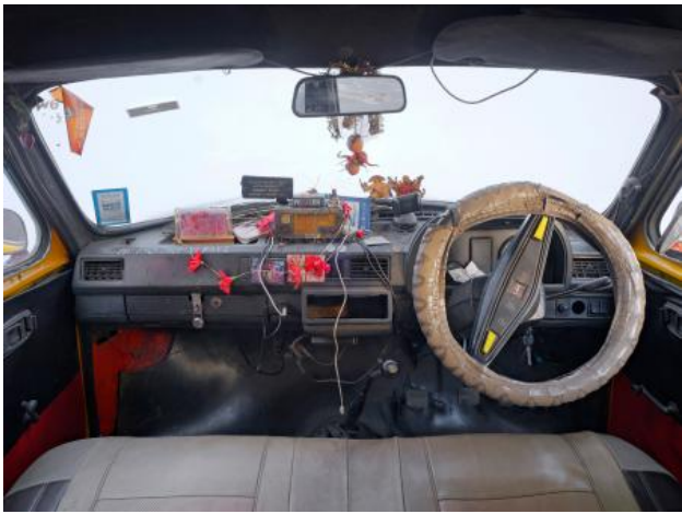
Nickname Amby: Journeys Through Past, Power, and Climate, 2025 fine art fotografie, 70 x 90 cm