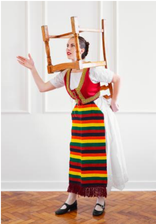
The Other Side of Reality, 2024 fine art fotografie, 60 x 40 cm / 100 x 70 cm