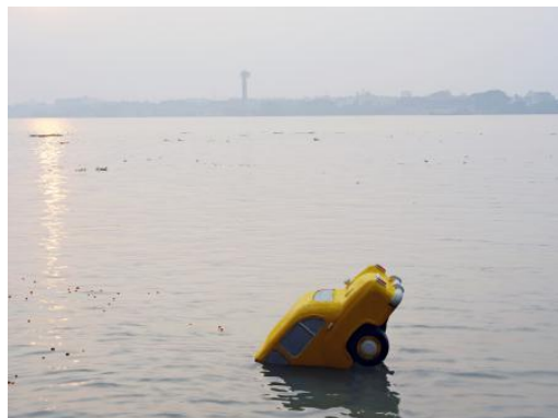
Nickname Amby - Journeys Through Past, Power, and Climate, 2025 fine art fotografie, 70 x 90 cm