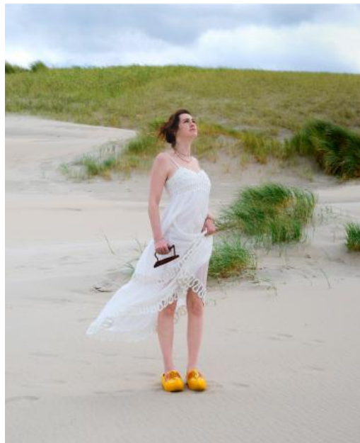
Zilt & Zout, 2025 fine art fotografie, 60 x 50 cm / 90 x 70 cm