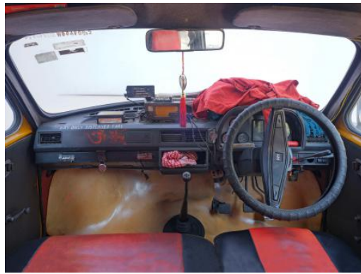
Nickname Amby: Journeys Through Past, Power, and Climate, 2025 fine art fotografie, 70 x 90 cm