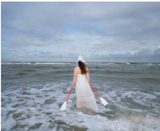
Zilt & Zout, 2025 fine art fotografie, 50 x 60 cm / 70 x 90 cm

2006 - Docent fotografie | redactionele 2014 praktijk, Technische Hogeschool Keulen, Duitsland