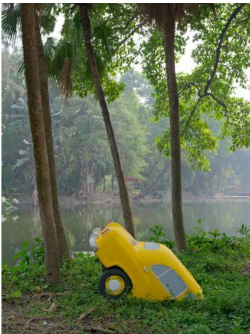
Nickname Amby: Journeys Through Past, Power, and Climate, 2025 fine art fotografie, 90 x 70 cm