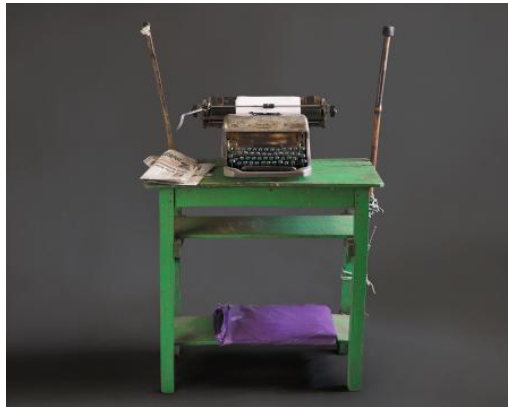
Typosphere - Tables, 2023 fine art fotografie, 50 x 60 cm / 70 x 90 cm