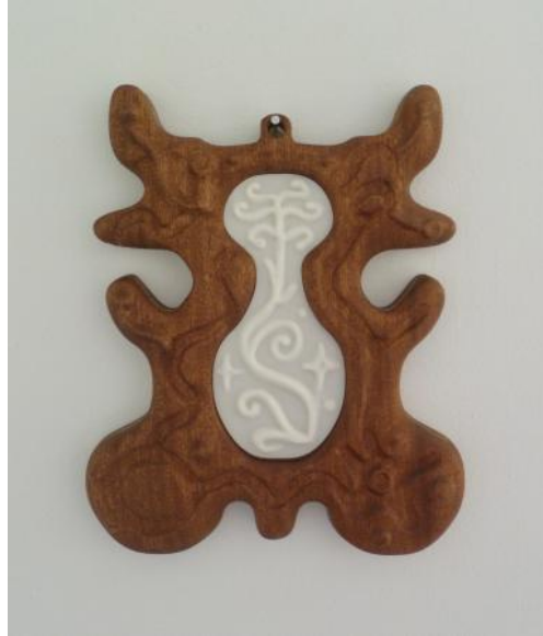
Sick Bug, 2024 Gegraveerd hout en PLA., 50x40x10 cm