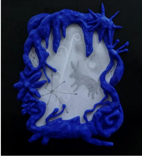
Nature Frame, 2024 PLA en grafiet op papier, 30x20x3 cm