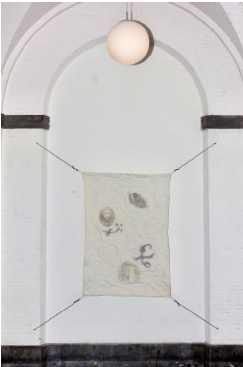
Ain't I a Woman?, 2023 Naaien, quilten en hittepers, 120x200x10 cm