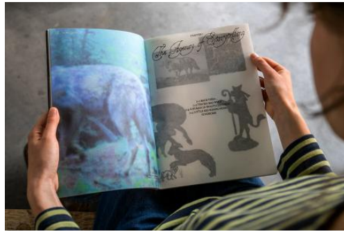
Wild Imaginations, 2025 Comcolor print, hand gebonden op japanse wijze, 30x45x1,5 cm