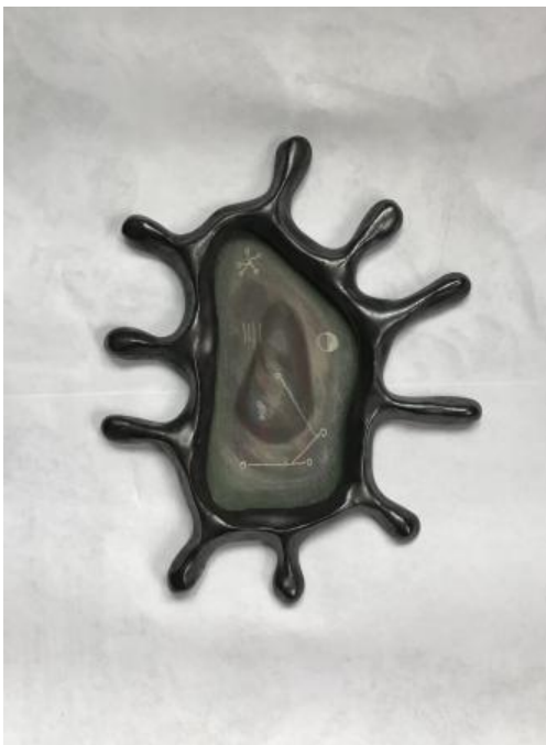
Portal, 2024 Keramik met glazuur. Pastelkrijt op papier, 20x15x1 cm