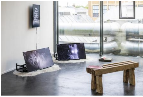
A Wild Encounter, 2025 Video editing, 3D rendering, 300x400x200 cm