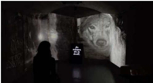
A Wild Encounter, 2025 Projectie van video edit, 3D render en script, 500x300 cm