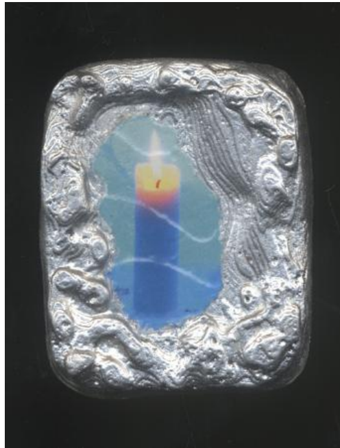
Metal Cast Frame, 2024 Metal casting + inktjet printer, 5x3x0.5 cm