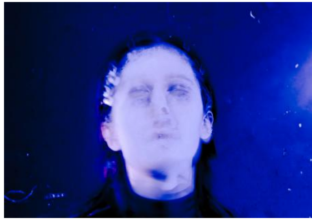
Morpheus, 2025 Fotografie en Photoshop