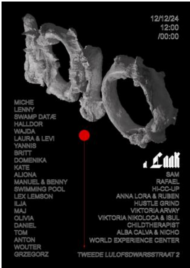
Poster 1010, 2025 digital mixed media, 1189 x 841