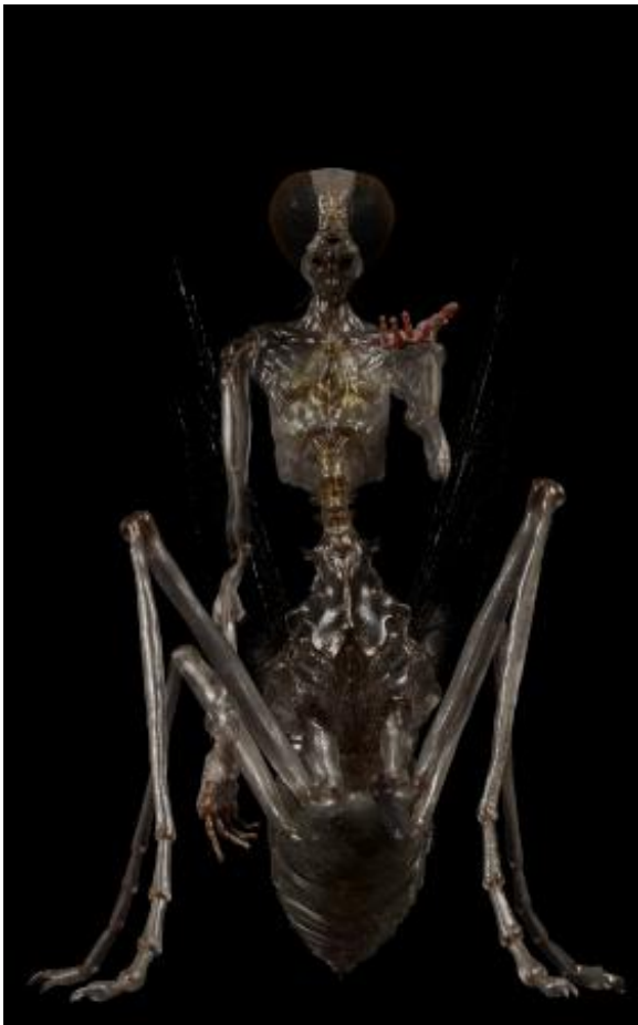
IO, 2025 3D Animatie, projectie op zwart canvas, 290 x 181