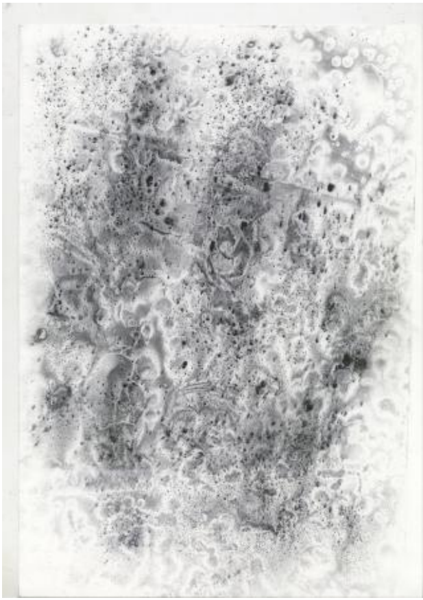
Static Transmutation, 2022 Toner poeder op papier, 420mm x 297mm