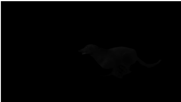
Lotus Eater, 2026 02:48