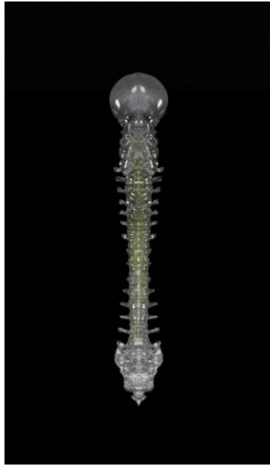
IO, 2023 digitaal 3D sculptuur, print op satin-gloss papier, 290 x 181