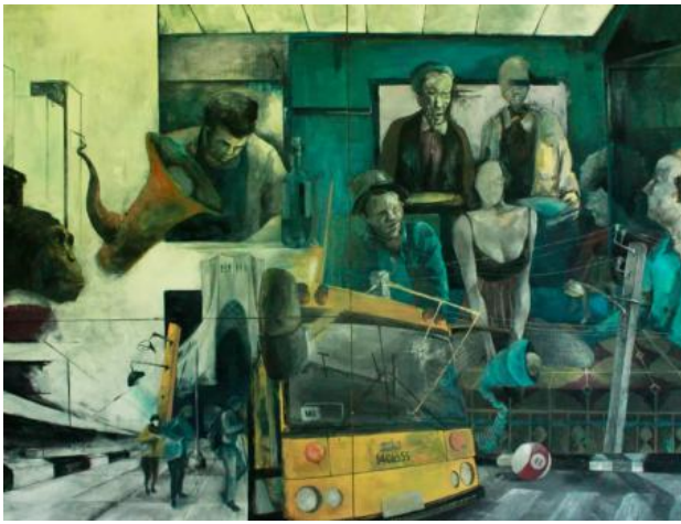
Onderwijs, 2023 Acrylic, 100x160cm