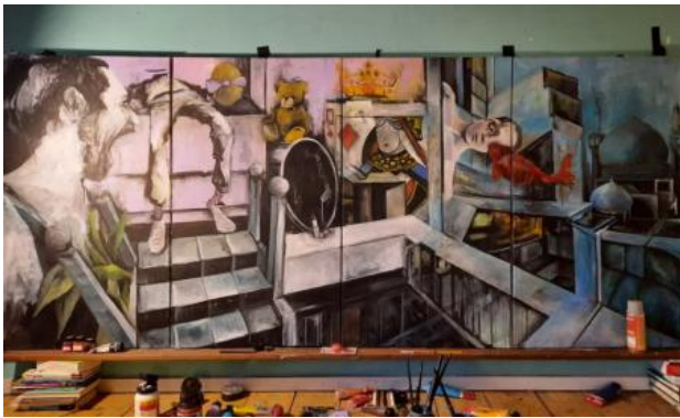
Tussenruimte, 2023 Acrylic, 90x240cm