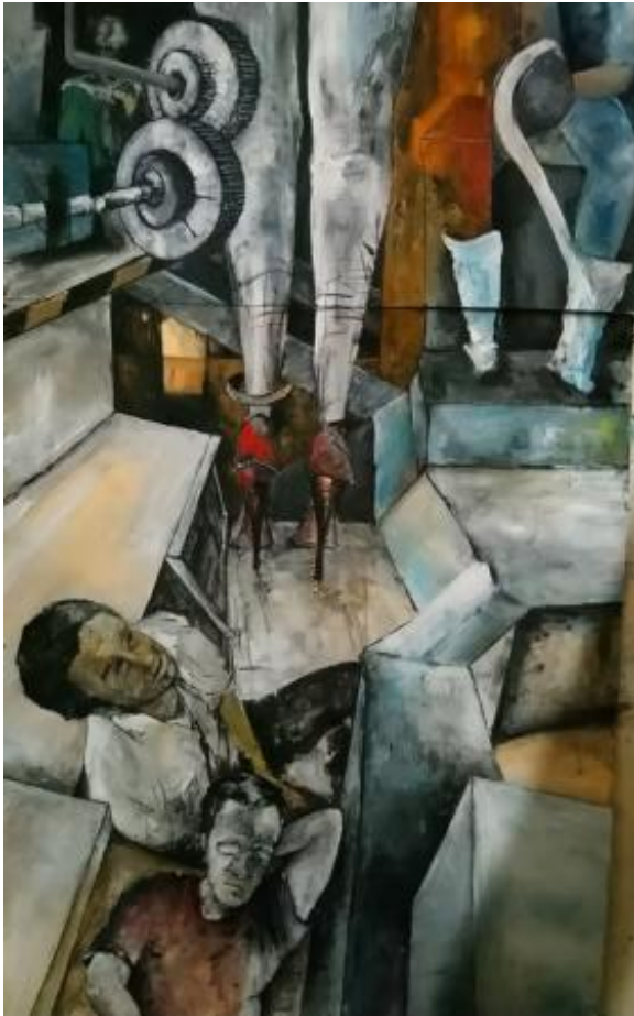
Verleiding, 2026 Acrylic , 50x75cm