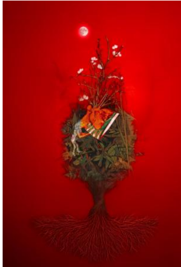
Rustend in Verwondering, 2026 Digital mixed met Ink , 40x60cm