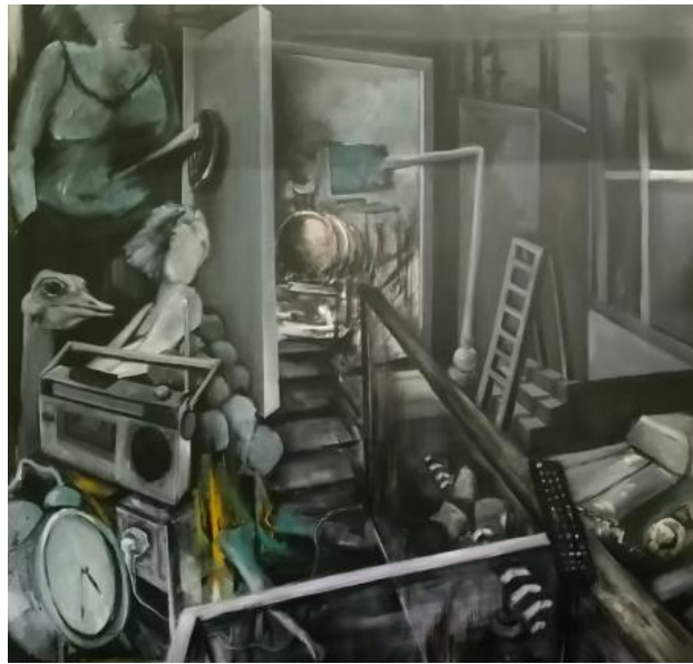
Tussen mij en oma, 2023 Acrylic, 100x100cm