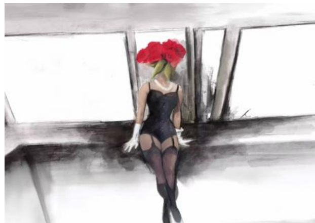
Haar Bestaan, Hun Angst, 2026 Digital mixed met Ink, 40x60cm