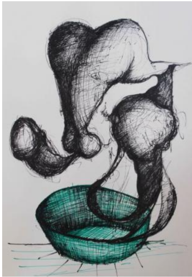
Besnijdenis, 2024 Ink, 30x40cm