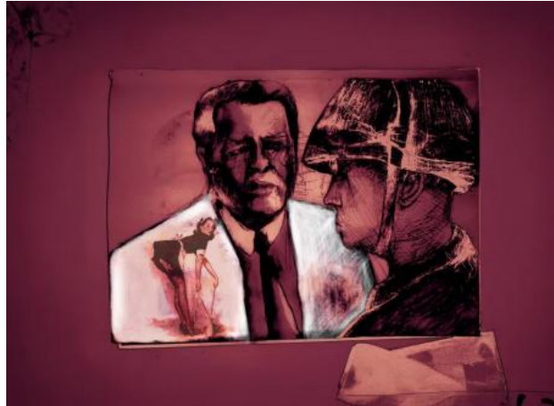
Soldaat, 2024 Digital mixed met Ink, 40x60cm