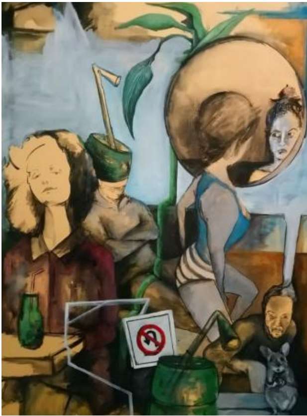
Tussen zijn benen, 2025 Acrylic , 60x80cm