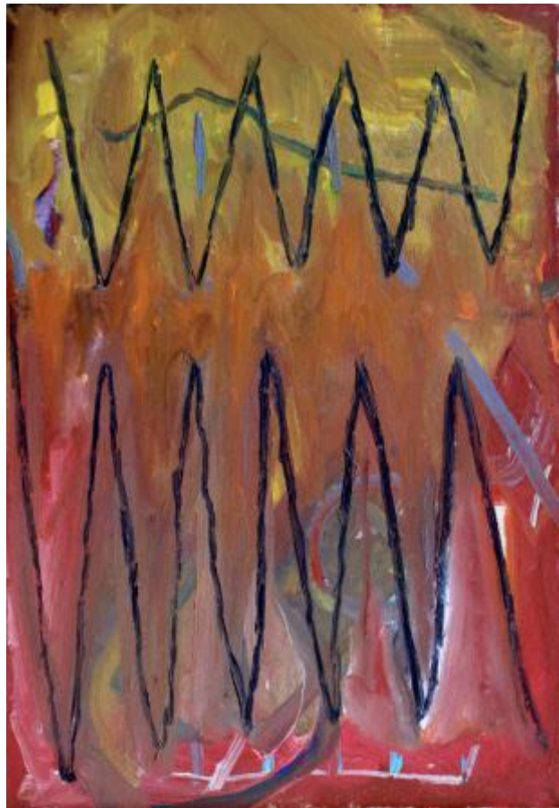
no title, 2023 olieverf op linnen, 77 x 53 cm