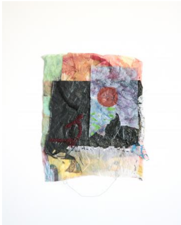
no title, 2024 watercolor, gesso, gelatinos glue made from rabbit, cotton thread, japanese paper, 31 x 26 cm