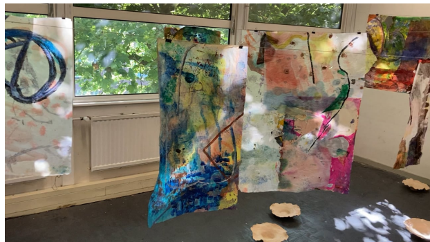
Open studio, 2024 0