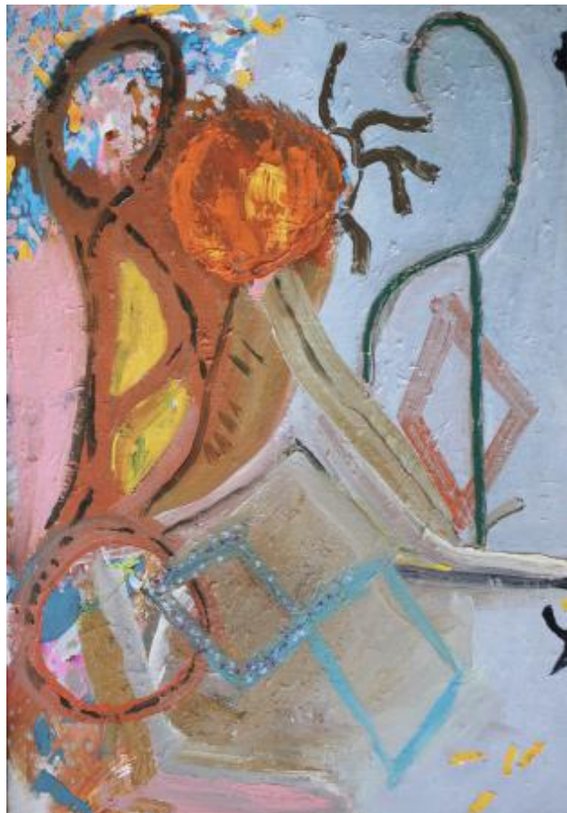
no title, 2023 olieverf op linnen, 77 x 53 cm