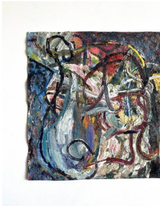
no title, 2024 oliepastel, aquarel, gesso, 45 x 39 cm