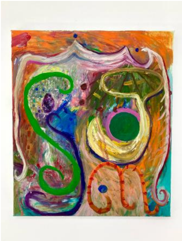
no title, 2025 olieverf op linnen, 45 x 39 cm