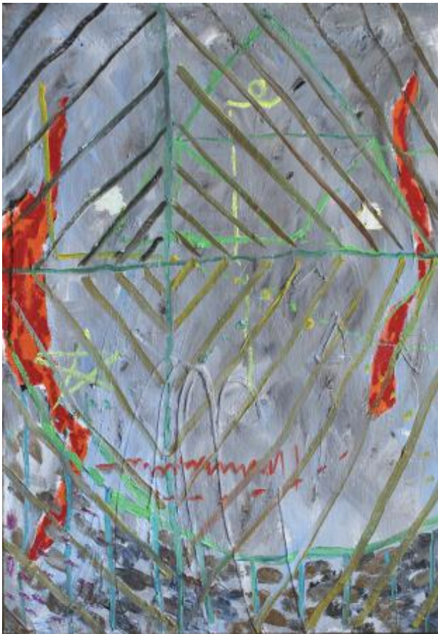
no title, 2023 olieverf op linnen, 77 x 53 cm