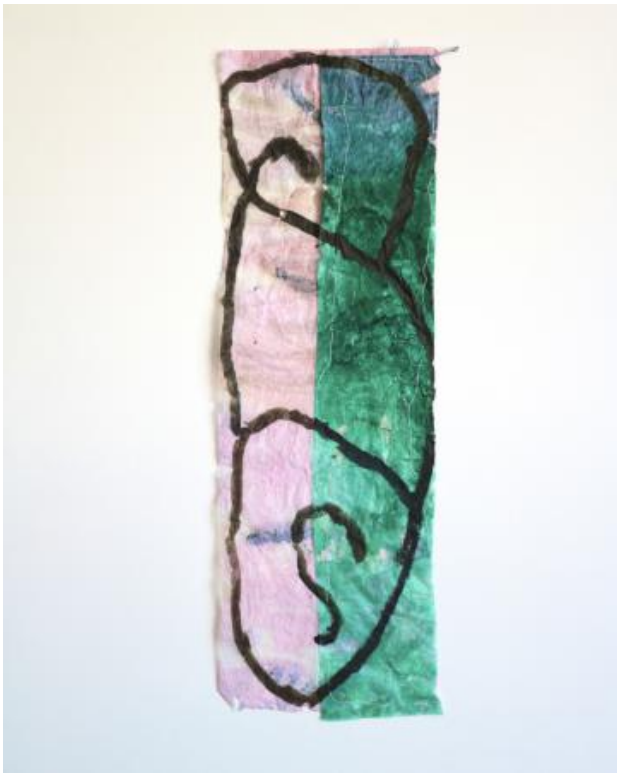
no title, 2024 watercolor, gesso, gelatinos glue made from rabbit, cotton thread, japanese paper, 63 x 21 cm