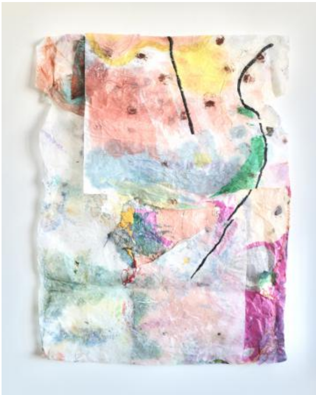
no title, 2024 watercolor, gesso, gelatinos glue made from rabbit, cotton thread, japanese paper, 100 x 77 cm