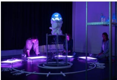
Doom Scroll Rehab: Cache Cleanse, 2025 3D geprint, CNC gesneden en gegraveerd, rituele cirkel met afmetingen van ongeveer 4,20 x 4,20 m