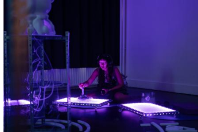
Doom Scroll Rehab: Cache Cleanse, 2025