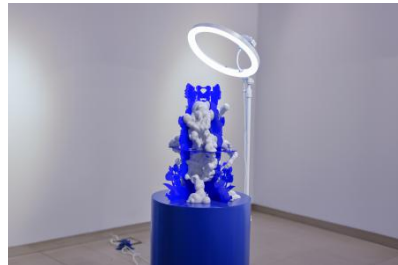
SPAM-Future Oracle, 2025 site-specifieke installatie bestond uit een 3D-geprint object, plexiglas uitsparingen, een led-lichtring en een audiostuk