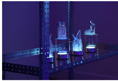
Doom Scroll Rehab: Cache Cleanse, 2025 3D-geprinte sculpturen van hars.