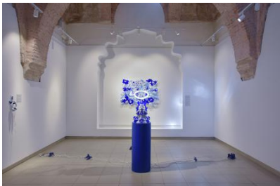
SPAM, 2025 site-specifieke installatie bestond uit een 3D-geprint object, plexiglas uitsparingen, een led-lichtring en een audiostuk