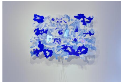
SPAM-In Defence of the abandoned billboard, 2025 Illustratie gedrukt op zelfklevende PVC-folie / plexiglas uitsparingen, 150x105cm