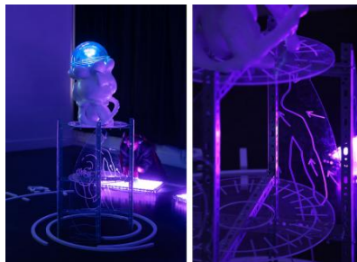
Doom Scroll Rehab: Cache Cleanse, 2025 3D geprint, CNC gesneden en gegraveerd, geschatte hoogte van 1,70 m