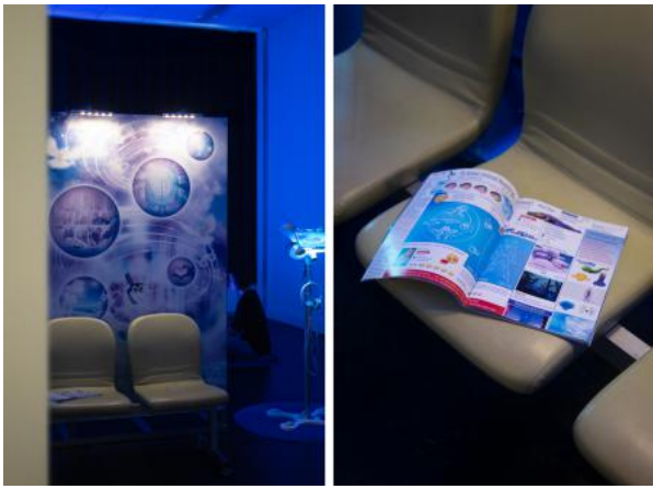
Doom Scroll Rehab: Cache Cleanse, 2025 Afdrukken op duurzaam materiaal