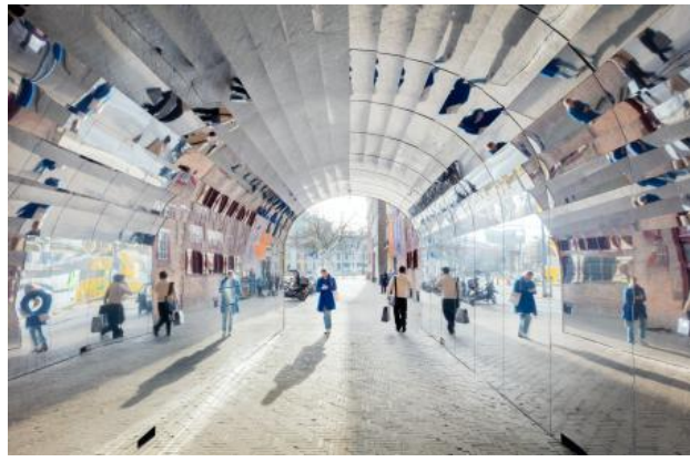
Spiegel Tunnel, 2025 Houtconstructie, aluminium spiegels, 8m x 4m x 4m