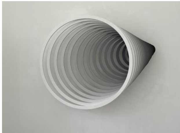
Horn of Plenty, 2024 CNC-gesneden cirkels, handgeschilderde gradient, 150cm x 110cm