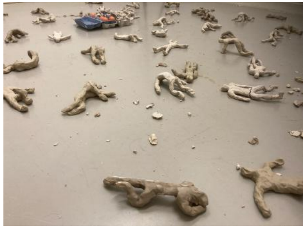
, 2023 Klei installatie, Afmeting onbepaald