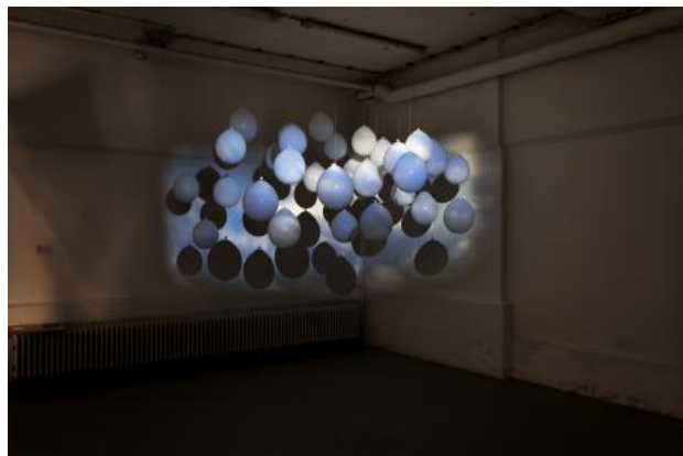
Balloonstaat, 2024 Latex balloon en projector