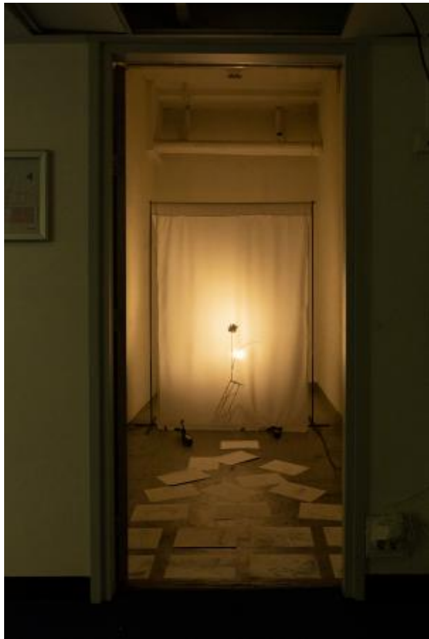
Bloem, 2023 metaal