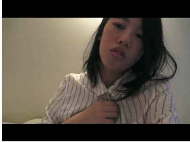
Queer dystopia, 2023 3:21