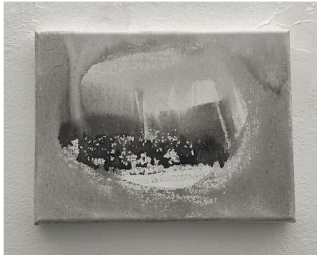
Vaarwel ergens, 2024 Acryl op canvas, 18x20