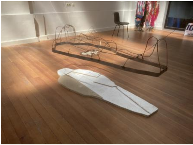
Lichaam is een kooi, 2023