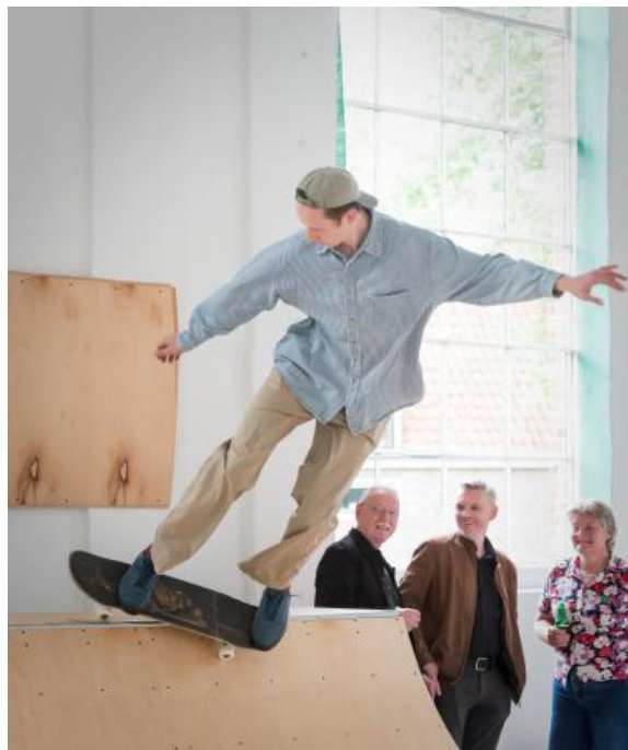
Backside feeble stall bij de opening van Up Worlds Down Words, 2025