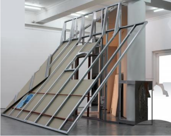
Loslaten, 2023 installation, 4 x 4 x 3m

Voor het goede dat ik zou doen, doe ik het niet, 2024 esdoorn, berk, den, 8.5 x 2.5 x 2.5m