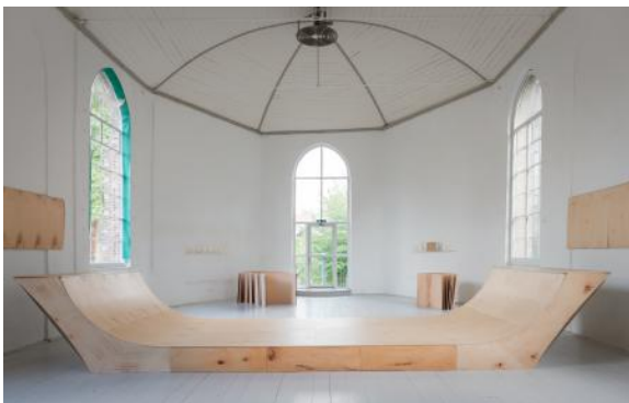
Opwoords Neerwerelds, 2025 gelamineerd esdoorn, vuren, 7.66 x 2.4 x 1.2 m