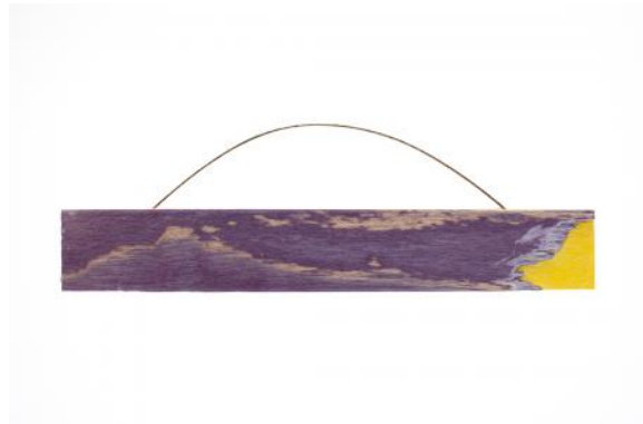
Kobold, 2025 Esdoorn, staal, 140 x 40 x 5mm