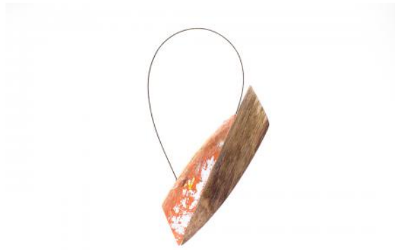
En Pointe, 2025 Esdoorn, staal, 100 x 60 x 5mm