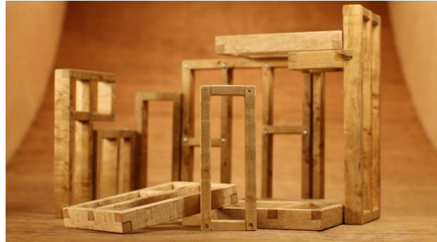
Fingerframe serie, 2022 00:03:16