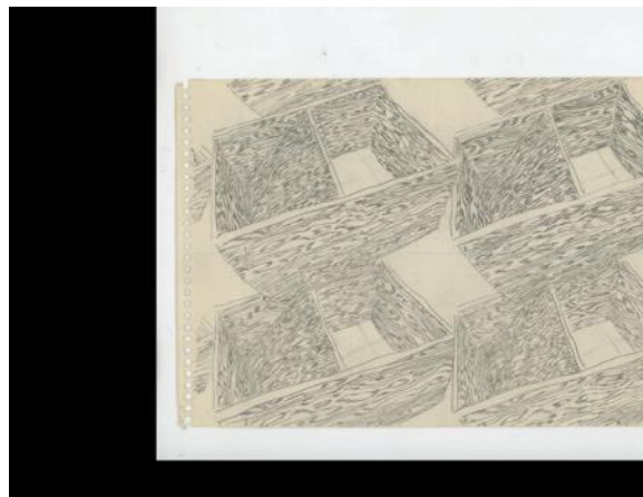
assemblagelijin voor kasten, 1/4 samenstelling, 2024 handgetekende animatie, 23 x 15cm