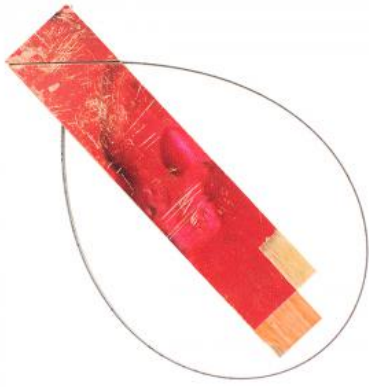
De Prachtige Wereld, 2025 Esdoorn, Staal, 100 x 60 x 5mm