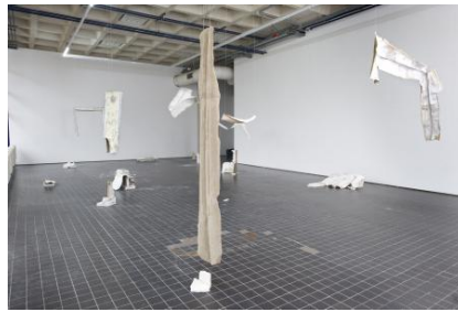
There is no home, like place, 2025 Muren van mijn voormalige studio gescheurd en gemonteerd op linnen doeken, afmetingen variabel