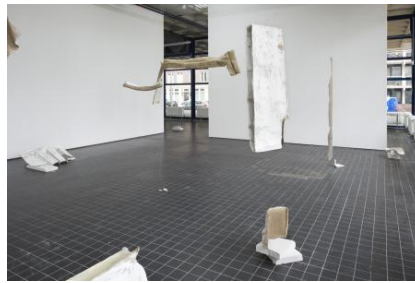
There is no home, like place, 2025 Muren van mijn voormalige studio gescheurd en gemonteerd op linnen doeken, afmetingen variabel