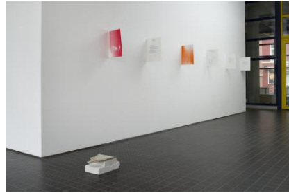
9 Possible Scenarios, 2025 Riso-print op Arena Natural Smooth-papier 300 g/m2, 29,7 x 42 cm