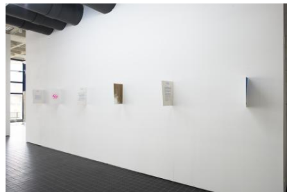
9 Possible Scenarios, 2025 Riso-print op Arena Natural Smooth-papier 300 g/m 2 , 29,7 x 42 cm