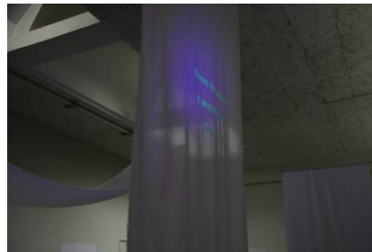
Night x Who Cares., 2026 Zeefdrukken op textiel en papier. Fosforescerende inkt, Afmetingen variabel