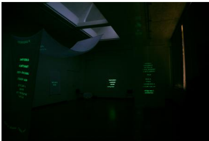
Night x Who Cares., 2026 Zeefdrukken op textiel en papier. Fosforescerende inkt, Afmetingen variabel