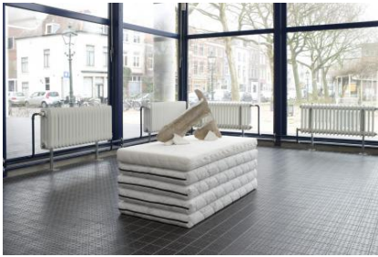
The Sleeper, 2025 Muren van mijn voormalige atelier afgescheurd en op linnen doeken gemonteerd, 60 x 53 x 8,5 cm 60 x 120 x 10 cm