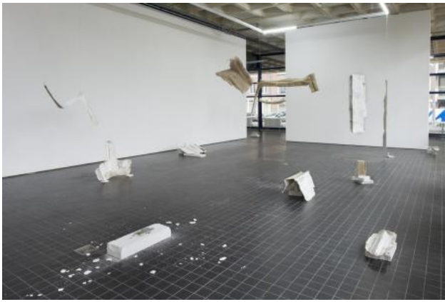
There is no home, like place, 2025 Muren van mijn voormalige studio gescheurd en gemonteerd op linnen doeken, afmetingen variabel