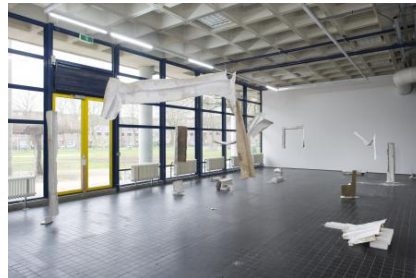
There is no home, like place, 2025 Muren van mijn voormalige studio gescheurd en gemonteerd op linnen doeken, afmetingen variabel