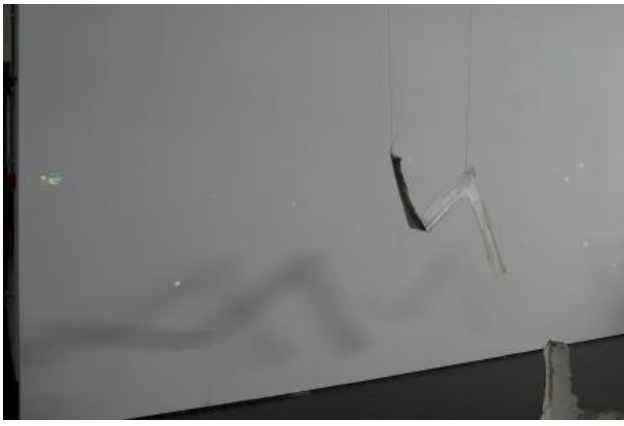
Locked Out In, 2025 UV-fosforescerende pigmenten geschilderd op de galerijwanden, ongeveer 2 x 2,5 cm per schilderij