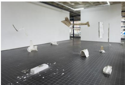
There is no home, like place, 2025 Muren van mijn voormalige studio gescheurd en gemonteerd op linnen doeken, afmetingen variabel