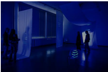
Night x Who Cares., 2026 Zeefdrukken op textiel en papier. Fosforescerende inkt, Afmetingen variabel