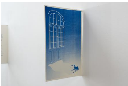
9 Possible Scenarios, 2025 Riso-print op Arena Natural Smooth-papier 300 g/m 2 , 29,7 x 42 cm