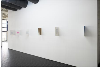
9 Possible Scenarios, 2025 Riso-print op Arena Natural Smooth-papier 300 g/m2, 29,7 x 42 cm