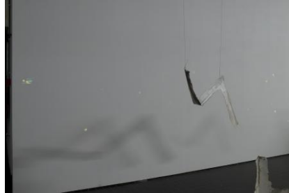
Locked Out In, 2025 UV-fosforescerende pigmenten geschilderd op de galerijwanden, ongeveer 2 x 2,5 cm per schilderij