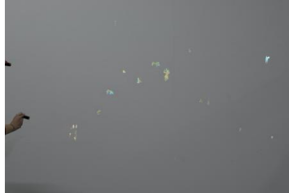
Locked Out In, 2025 UV-fosforescerende pigmenten geschilderd op de galerijwanden, ongeveer 2 x 2,5 cm per schilderij