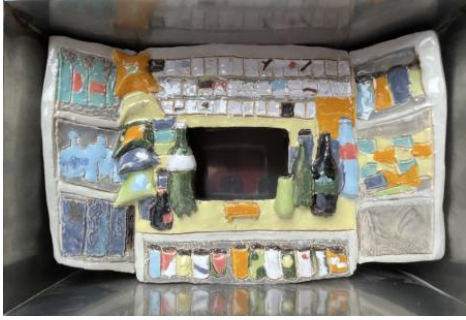
Klekshop, 2023 Geglazuurd keramiek, metalen doos, 18 x 8 x 13 cm.