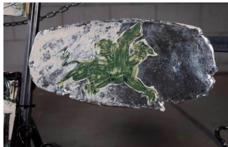
Mijn altaar detail, 2021