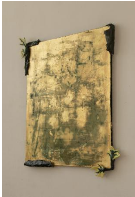
Iconisch schilderij, 2022 Bladgoud op canvas, lijst van keramiek, 80 x 100 cm.