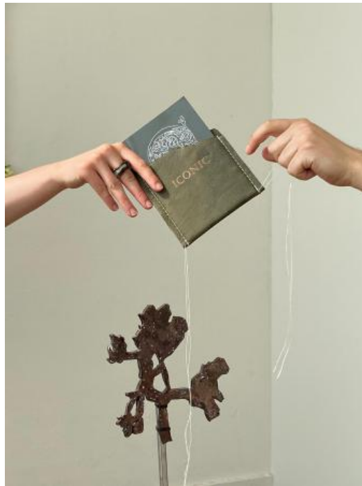
Iconic, 2022 Gedrukt boekje, op maat gemaakt lederen zak met letterpers