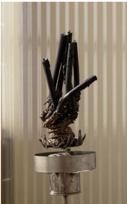
Draaiende kandelaar, 2022 Metalen standaard, ruitwisselmotor, keramische sculptuur, waskaarsen