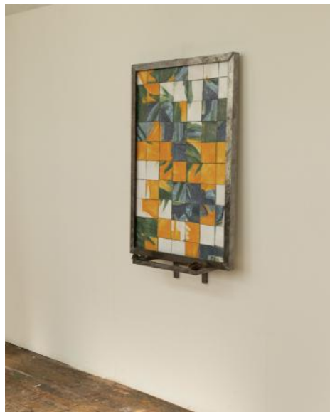
Keramisch schilderij, 2022 70 keramische handgemaakte tegels, metalen frame & standaard, 5€, diverse munten, 90 x 25 x 110 cm.