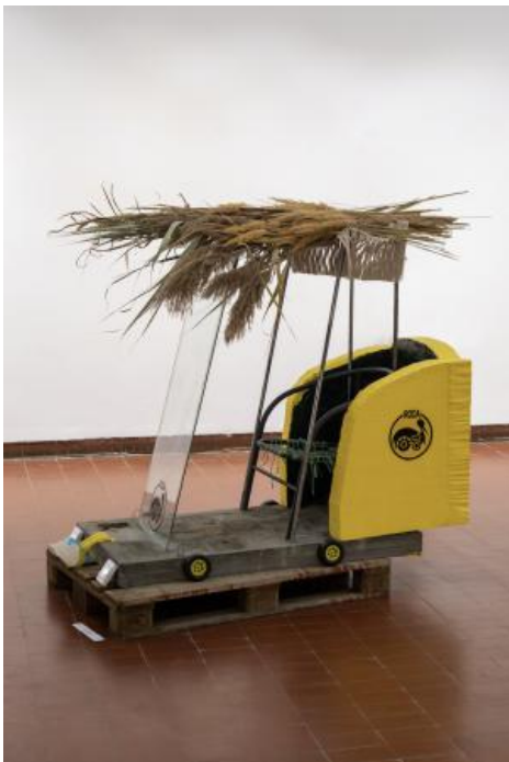
Tractor, 2022 Beton hout metaal glas piepschuim gedroogde pampa plastic details, 150 x 90 x 120 cm.