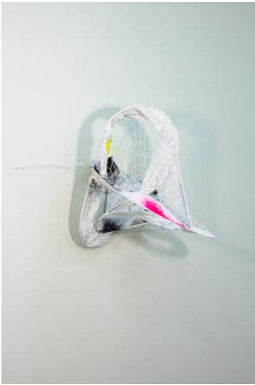
Geen titel, 2022 Acryl en spray op voetbalnet, 81 × 78 × 62 cm (H × W × D)