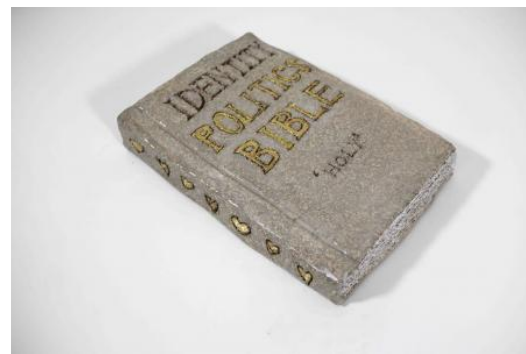
Bijbel over identiteitspolitiek, 2023 Keramik, 29 x 20 x 4.5 (cm)