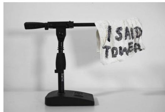
Ik zei een 'tower', 2023 Keramik op een MIC stand, 21 x 20 x 16 (cm)