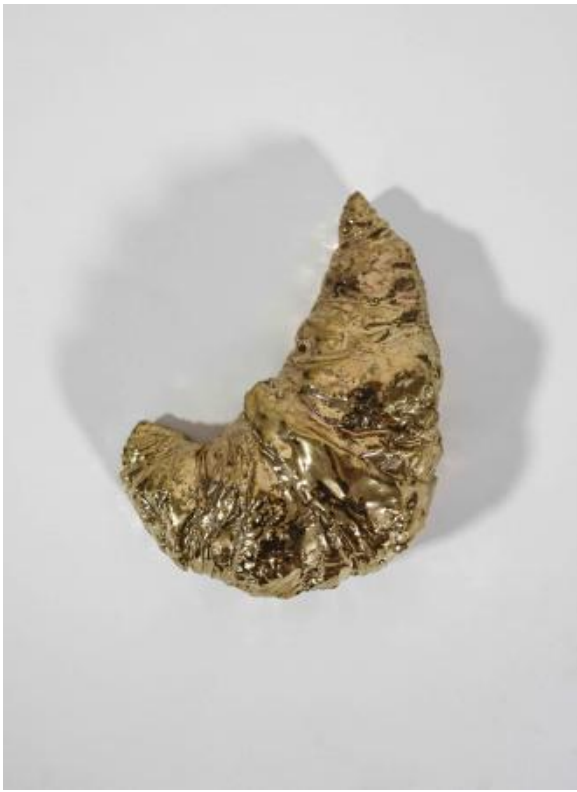
De Griekse godin van de overwinning is vandaag dik, 2023 Keramik, 15 x 11 x 8 (cm)