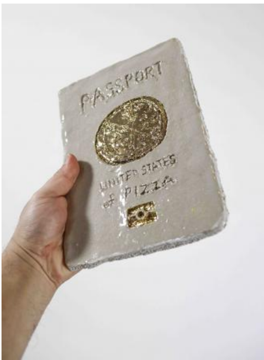
Universeel paspoort, 2023 Keramik, 25 x 17 x 1.8 (cm)