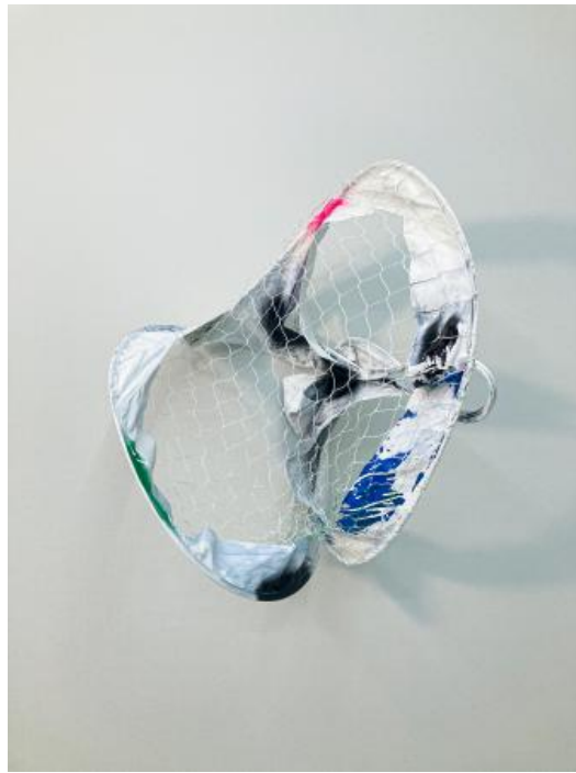
Geen titel, 2022 Acryl en spray op voetbalnet, 103 × 95 × 65 cm (H × W × D)