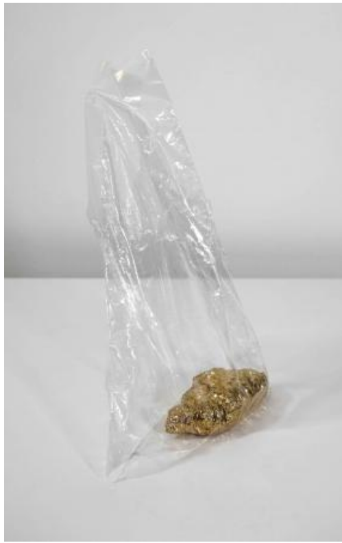
Kom niet te laat, 2023 Keramik, 16 x 7 x 5 (cm)