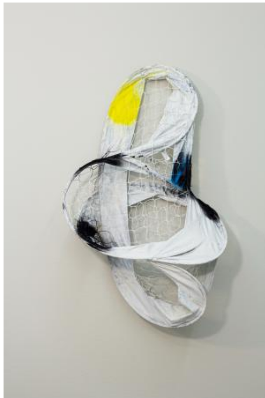
Geen titel, 2022 Acryl en spray op voetbalnet, 117 × 69 × 17 cm (H × W × D)