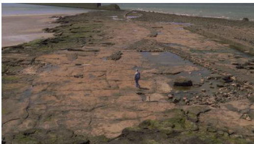
Insomnia, 2026 Film, 64 min.