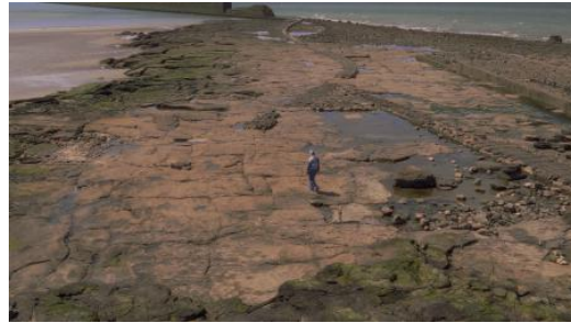
Insomnia, 2026 Film, 64 min.