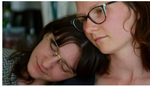
Insomnia, 2026 Film, 64 min.