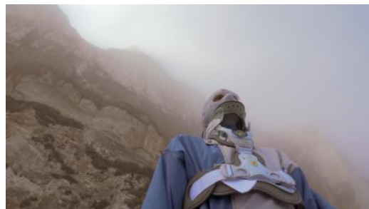
Insomnia, 2026 Film, 64 min.