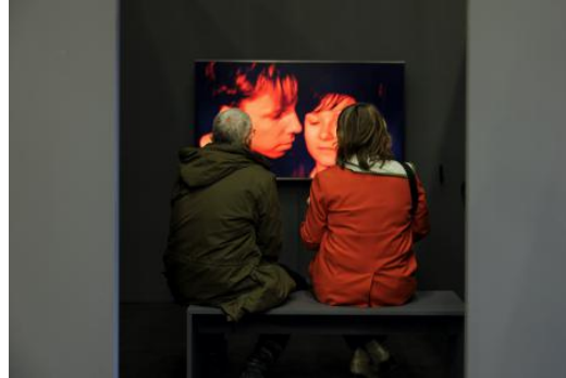
(un)scripted, 2024 Film, 16 min.