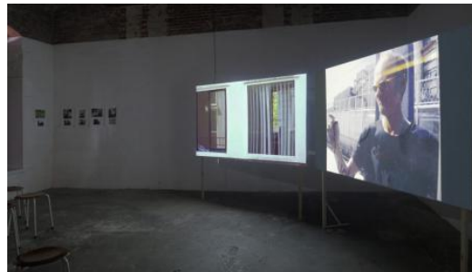
De Mislukte Vakantie - matathon, 2024 Video-installatie, 18 min.