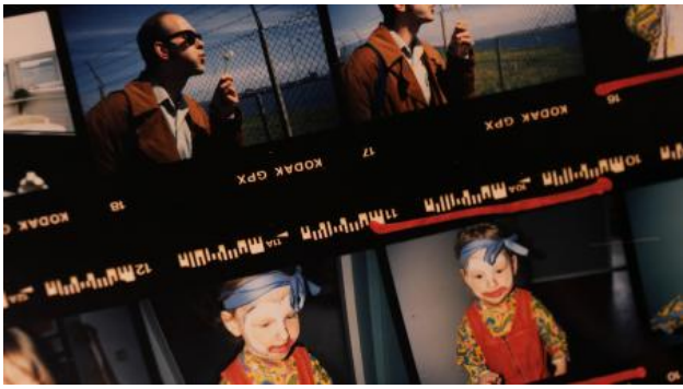
Insomnia, 2026 Film, 64 min.