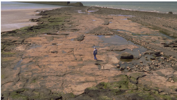
Insomnia (trailer), 2026 01:32