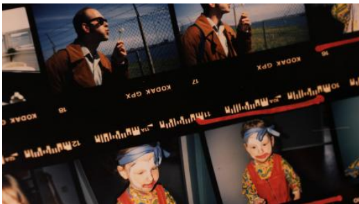
Insomnia, 2026 Film, 64 min.