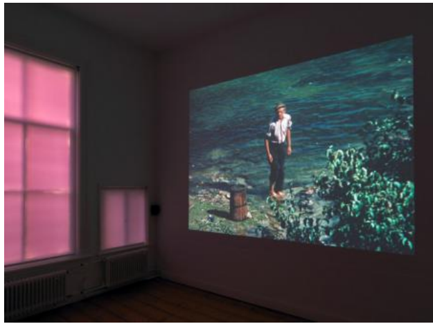
Lake Bottom Cinema, 2023 Film, foto by Gert Jan Van Rooij, 25 min.