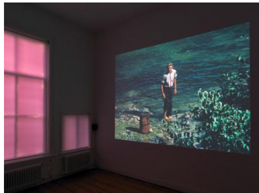
Lake Bottom Cinema, 2023 Film, foto by Gert Jan Van Rooij, 25 min.