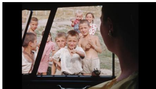
Lake Bottom Cinema, 2023 Film, 25 min.