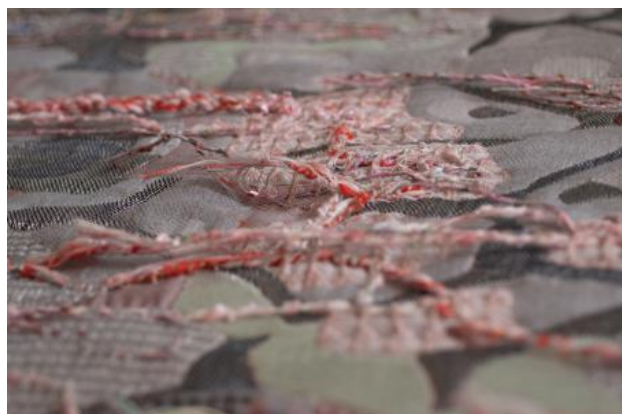
Detail van Builded System, 2021