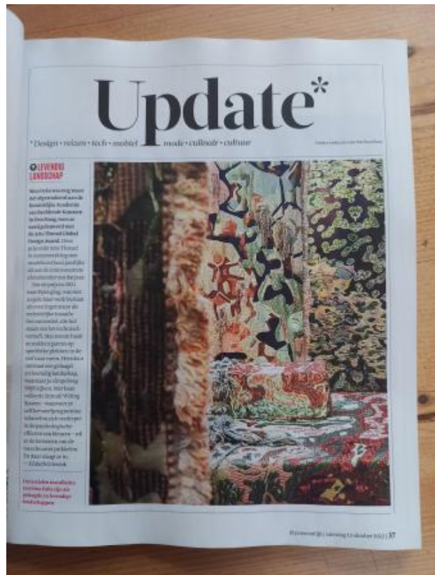
FD Persoonlijk, 2022