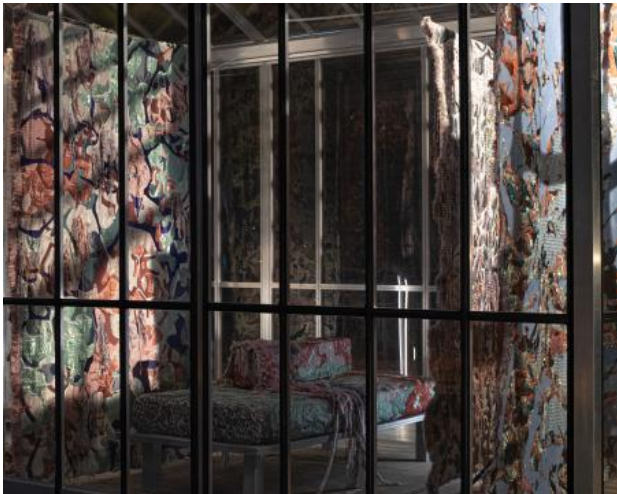
Collectie Stimuli Wiring System, 2021 Weven, spinnen, twijnen