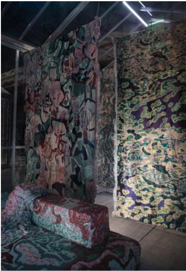
Collectie Stimuli Wiring System, 2021 Weven, spinnen, twijnen