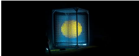
Into Thin Air, 2022 Mixed Media, 4 * 4 * 5 meters