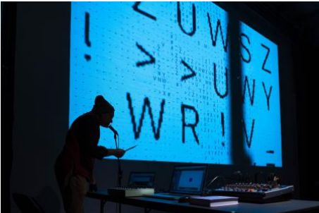
DataTone (AV Performance), 2023