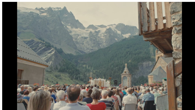
Au Fond Du Ciel, 2025 00:19