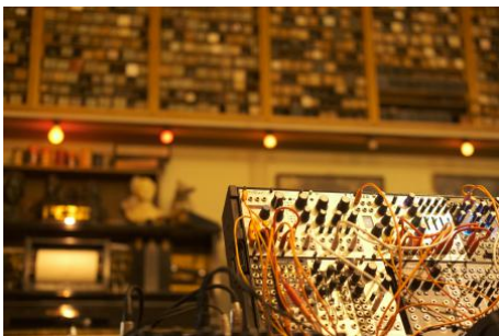
Ballet Stochastique, 2026 Modular synths, Improvisation, Performance