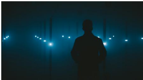
Ocean Boom - Rotterdam Art 2022, 2022