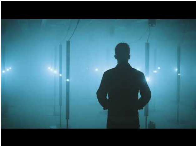
Ocean Bloom - Rotterdam Art 2022, 2022 1:00