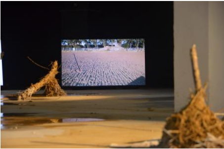
Ways of Landmaking, 2023