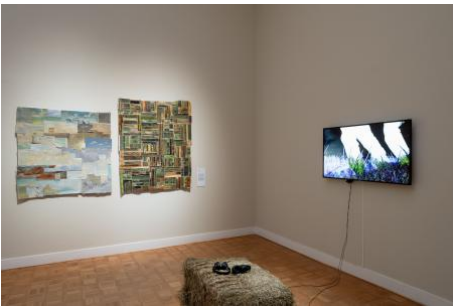
Machines for Self Care, 2023