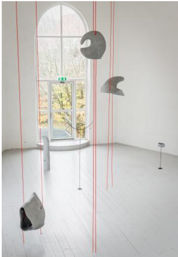
Moonhorn, 2025 keramiek, touw, audio, metaal, dimension variabel