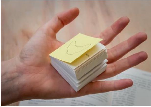
Seek You - premises of moonhorn promises, 2025 Boek, 13.5 x 21