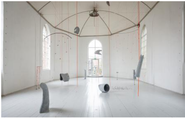
Moonhorn, 2025 keramik, touw, audio, metaal, dimension variabel