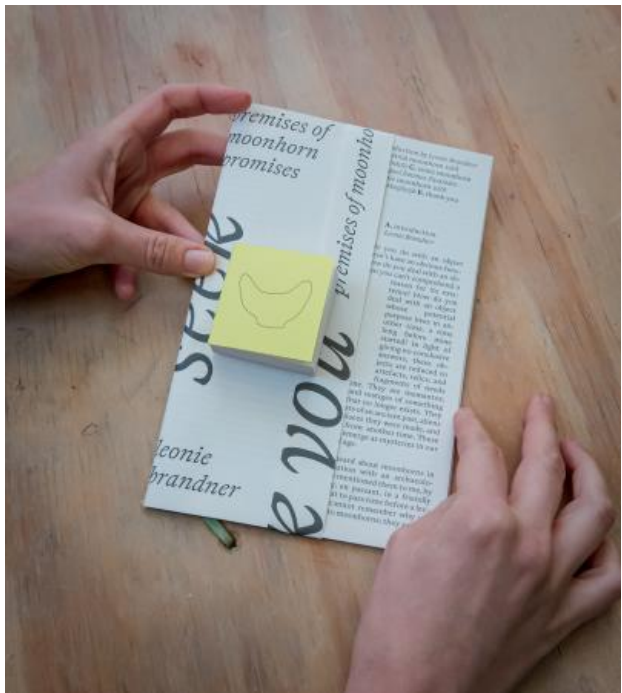
Seek You - premises of moonhorn promises, 2025 Boek, 13.5 x 21