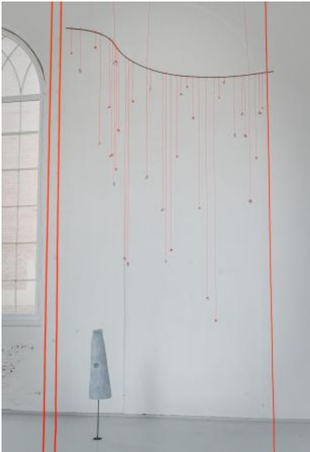
Moonhorn, 2025 keramiek, touw, audio, metaal, dimension variable