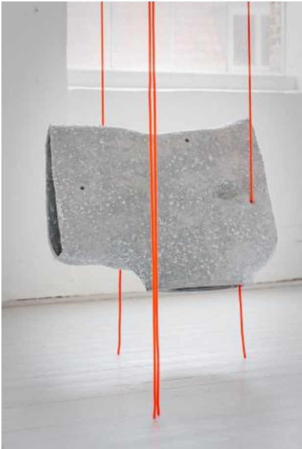
Moonhorn, 2025 keramiek, touw, audio, metaal, dimension variabel