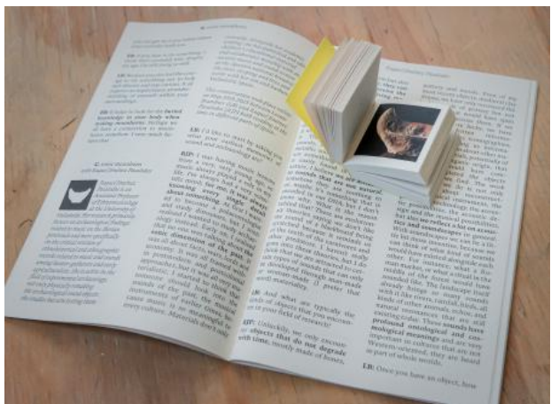
Seek You - premises of moonhorn promises, 2025 Boek, 13.5 x 21