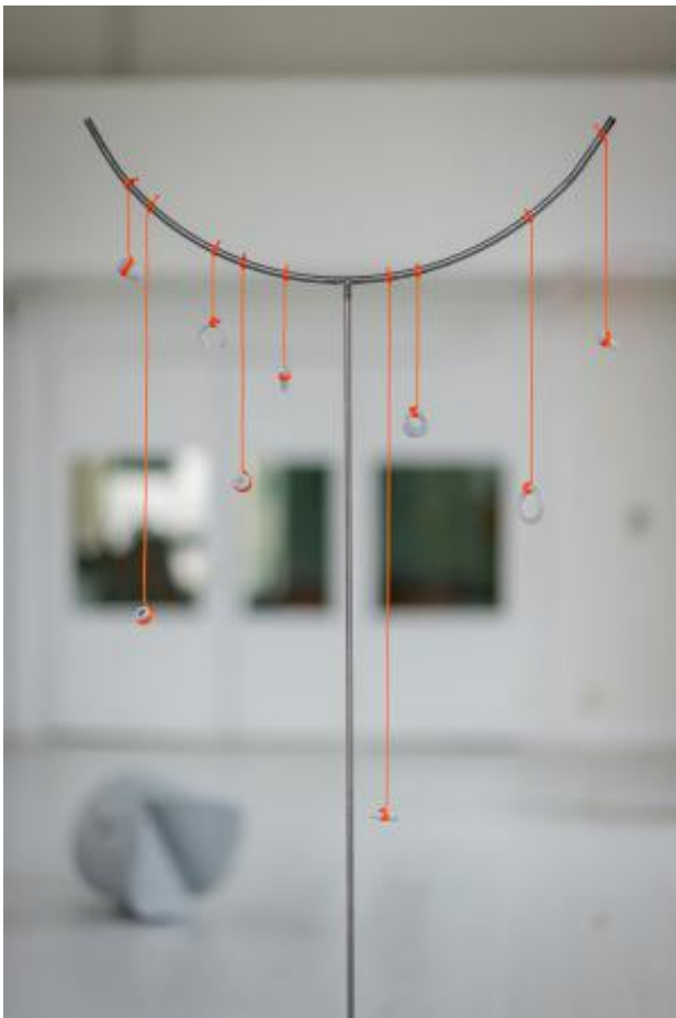
Moonhorn, 2025 keramik, touw, audio, metaal, dimension variabel