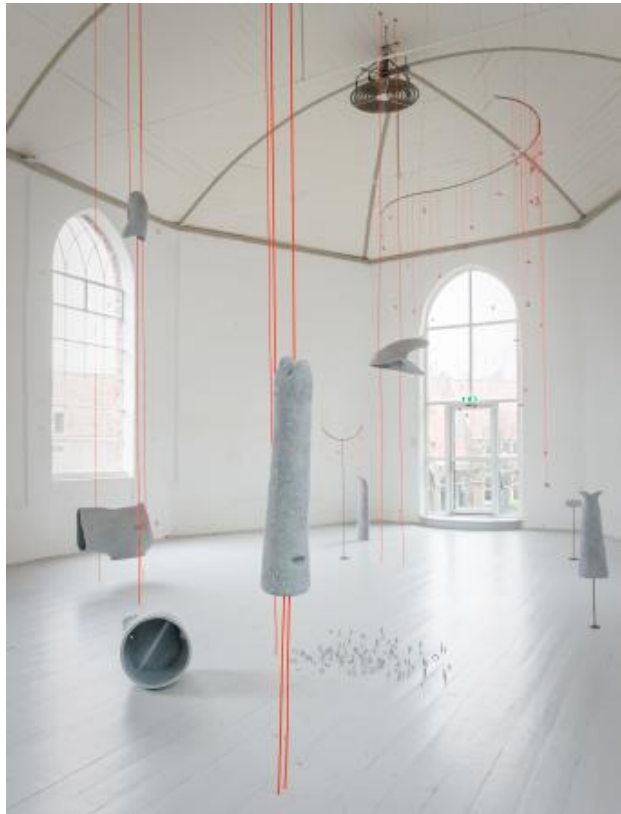
Moonhorn, 2025 keramiek, touw, audio, metaal, dimension variabel