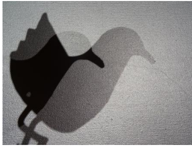
Fotoserie "The flow of life", 2023 Fotografie , 40x30