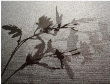
Photoserie "The flow of life", 2023 Fotografie , 40x30