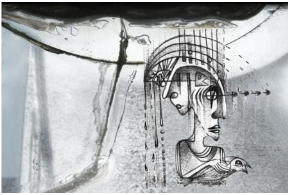
Ik en jij, 2023 Gemengde techniek , 15x10