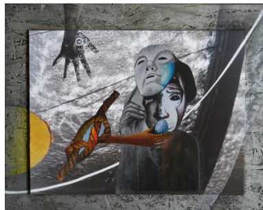
De vermomming , 2023 Gemengde techniek , 48x39