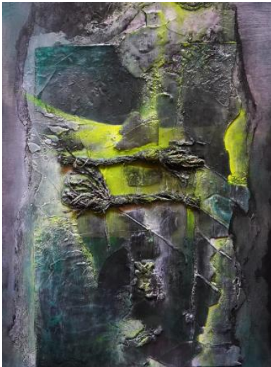
De groenen omhelzing , 2023 Gemengde techniek , 37x50

is de winnaar van de MENA Film Festival The Hague Den Haag, Nederland Jury rapport Sona was in staat om een verband te leggen tussen zichzelf en de elementen van de omringende natuur. Wanneer menselijke relaties achteruitgaan tijdens corona en beperkt worden door de vereisten van de corona pandemie, heeft de maker niets anders dan zich opnieuw te hechten aan levende wezens die leven met ons op deze planeet. Het is een overwinning van leven en beweging en een heroverweging van de roos die spontaan midden op de weg groeit. Verhaal van de film Sona: "De film " Everything comes and goes" gaat over de vergankelijkheid en de cyclus van het menselijk bestaan. Ik ervaar de coronatijd als een gebeurtenis waar alles komt en gaat . Het leven is eindeloos en oneindig, en geboorte en dood zijn slechts overgangen. Verandering vindt altijd plaats en vernietiging, verwoesting en verval die leiden tot een nieuw bestaan. Dus ik wil laten zien dat je alle kleine dingen in je leven moet waarderen, ervan genieten en een positieve kijk moet hebben, hoe moeilijk de situatie ook is."