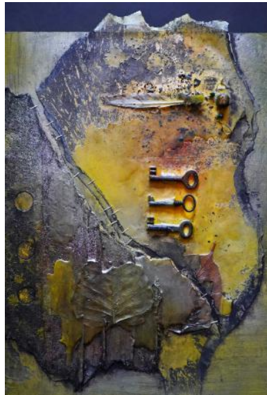
De laatste hoop , 2023 Gemengde techniek , 37x50