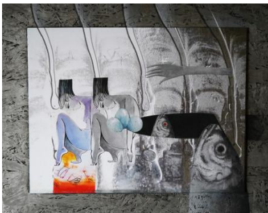
De bezieling , 2023 Gemengde techniek , 48x39