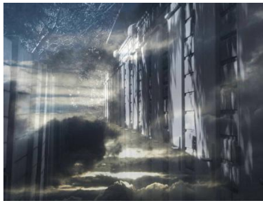
Komen en gaan , 2023 Mixed media, 30x40