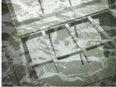
De overvloed , 2023 Mixed media , 30x40