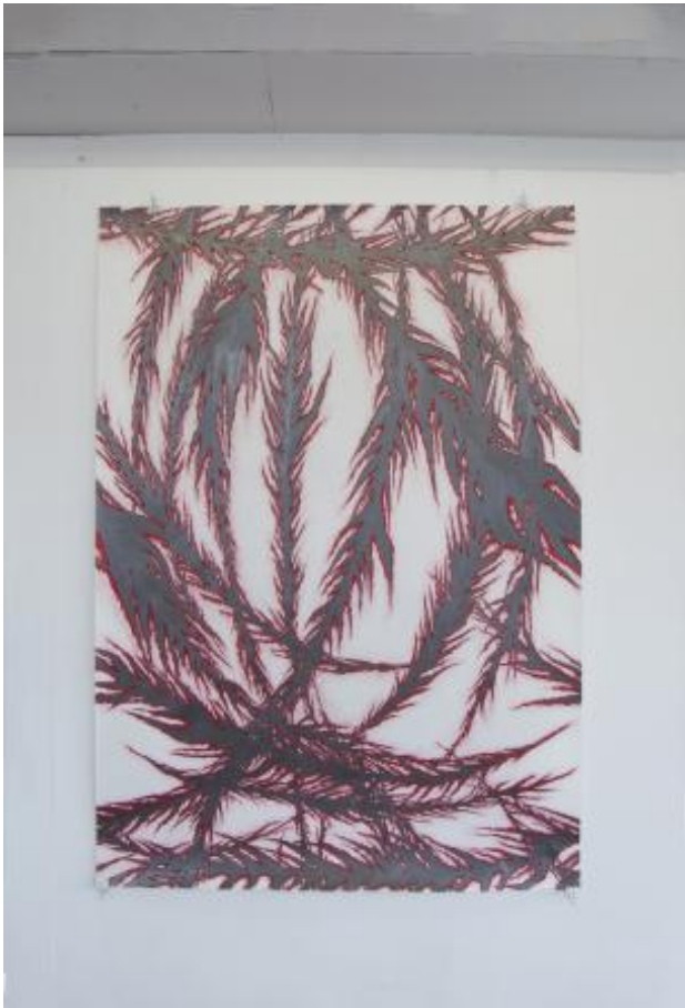
Carve II, 2023 Pencil and graphite on paper, 1,80m x 1,30m