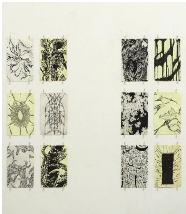
Bitmap tekeningen, 2023 Fineliner and pencil on paper, 105 mm x 148 mm