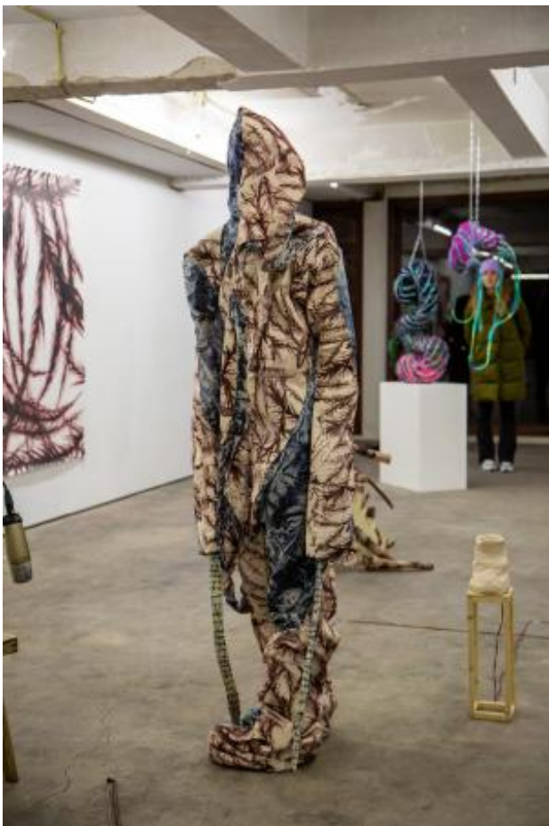
Dual Human, 2023 Zeefdruk op textiel, Variabel