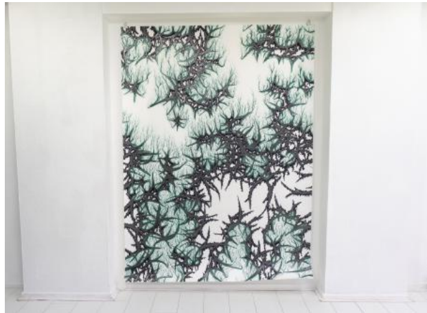
Rot, 2024 Grafiet en kleurpotlood op papier, 2m x 1,50m