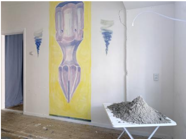
drilling in to a mountain, 2023 pigment op muur