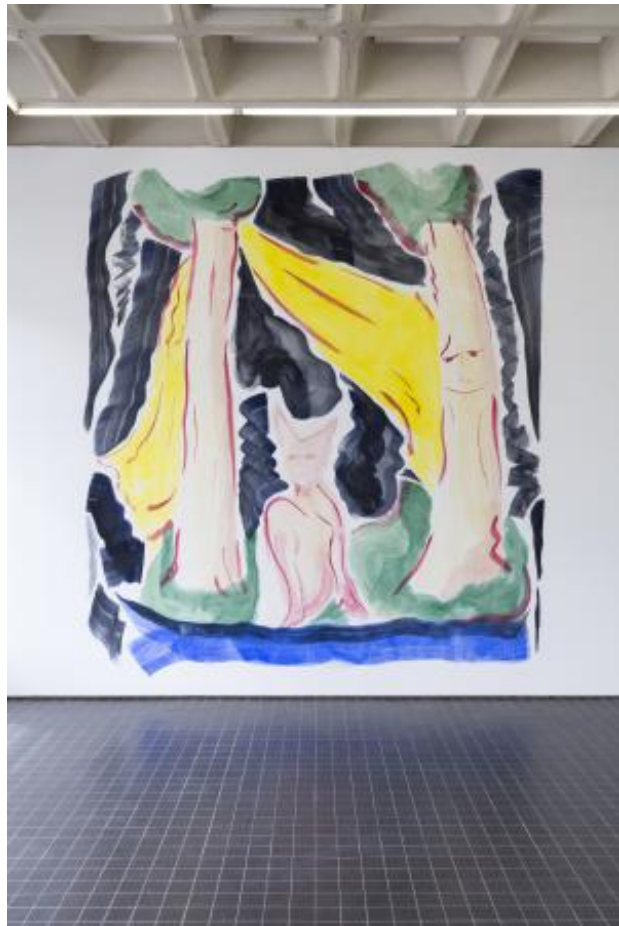
From Billy to the Hills, 2022 pigment en caseine