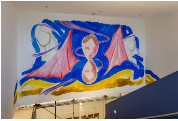
mirror mirror, 2025 pigment en caseine, 5 m X 3,5 m