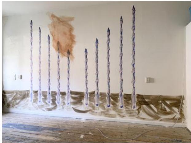
drilling in to a mountain, 2023 pigment op muur