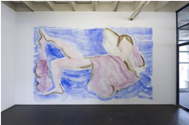
From Billy to the Hills, 2022 pigment en caseine