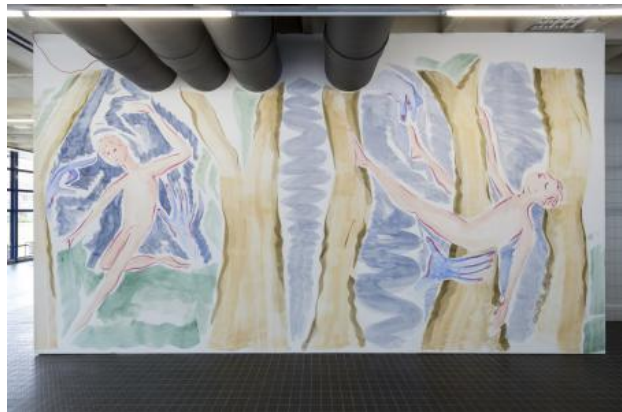
From Billy to the Hills, 2022 pigment en caseine