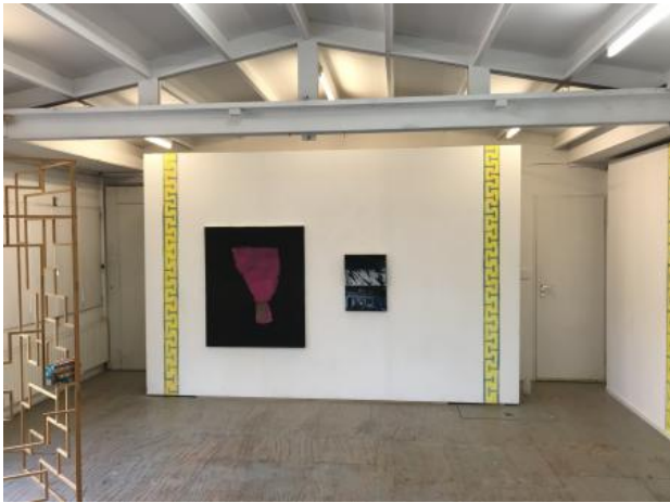
a grand day out, 2023 pigment op muur, 10 m x 2.10 m