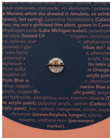
Material Bias in Memories (Alberto Aguilar), 2026