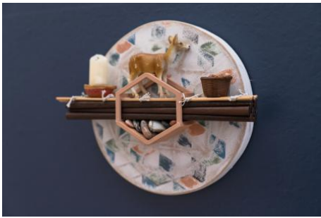
Material Bias in Memories (Alberto Aguilar), 2026