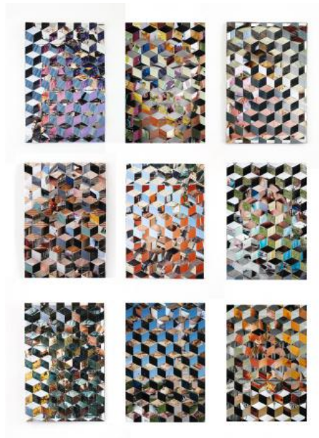
Tesselescence (Woven Photographs, 2021 Weven, 10 x 15 (elk)