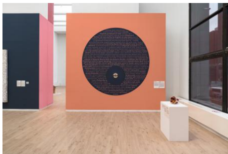
Material Bias in Memories (Alberto Aguilar), 2026