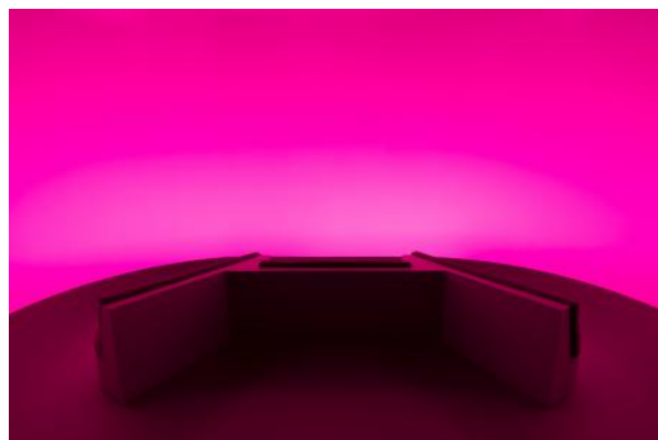
Chasing The Dot, 2024