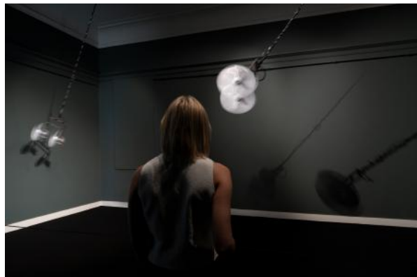
Flying, 2024 Motors, elastics, speakers, cables, amplifier, metal