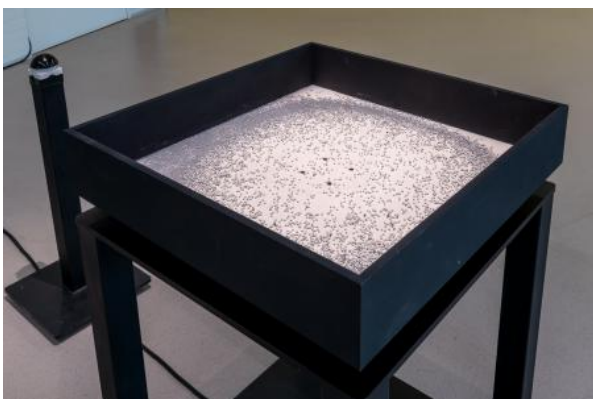
RrrrRrrr, 2025 Steel Glass marbles Low frequency direct drive/tactile transducer Wood, 1 x 1 x 1.50 m