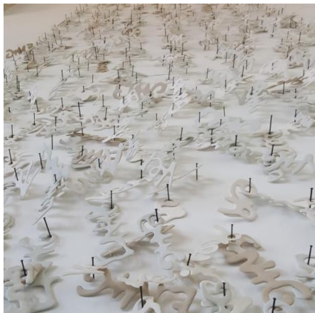
VerEnig, 2019 handgeschreven porselein & stalen nagels, 180x380cm