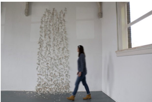
VerEnig, 2019 handgeschreven porselein & stalen nagels, 180x380cm