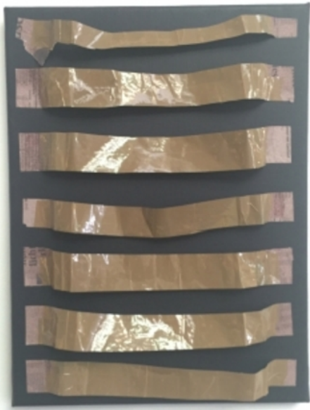
#3, 2016 collage op beschilderd canvas, 20x30 cm