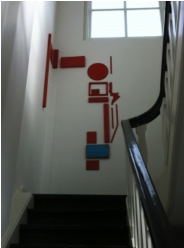
#7, 2014 acryl op hout, afh. van de presentatie