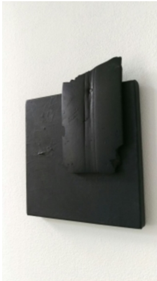
#7, 2013 rubber op met acryl beschilderd canvas, 20x20 cm