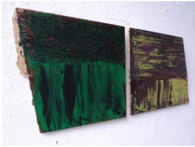
#4, 2011 met acryl beschilderde gebroken plank, 65x27 cm