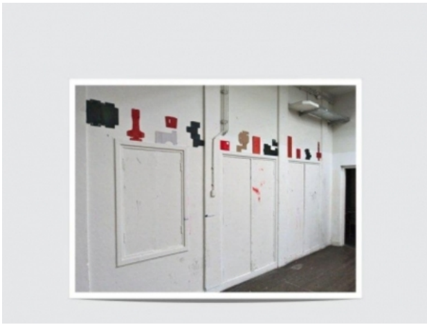
#3, 2012 acryl op karton, afh. van de presentatie