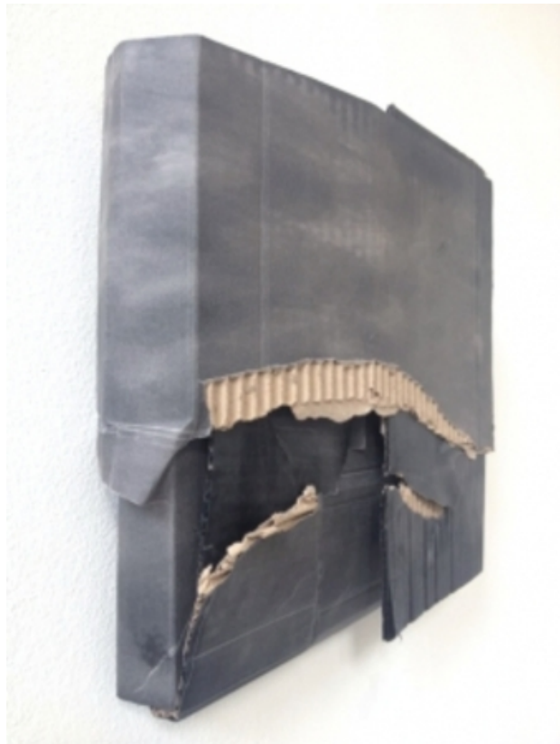
#15, 2015 inkt op karton, 30x30x5 cm