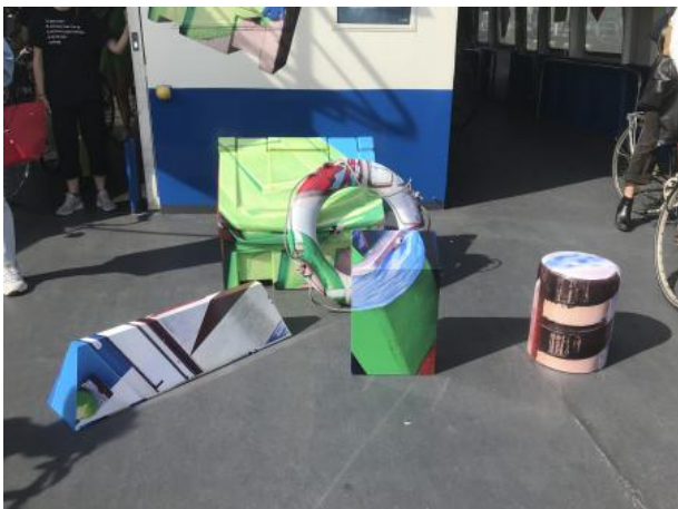
Verdwaal van hier naar daar vandaan dwaal af, 2022 Objects, Photoprint