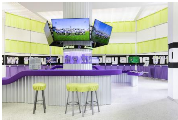
SIDELINED — La Biennale 2025, 2025 Tentoonstellingsontwerp