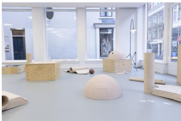
Pointing At Things Is The New Writing , 2025 Keramik

2015 Aanmoedings Invest Award STROOM, Den Haag