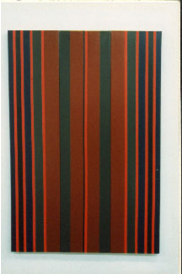
zt, 1997 acryl op katoen, 90-150 cm

1999 K.J.D. Bouw Partners BV Flat gebouw Astrium, Den Haag