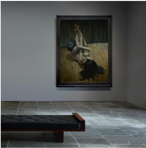
Metafoormorfose#13, 2021 olieverf op doek met lijst, 182x142x7