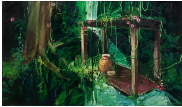
vuurvlieën en de zielen van de Iban in, 2009 olieverf op linnen, 320 x 160