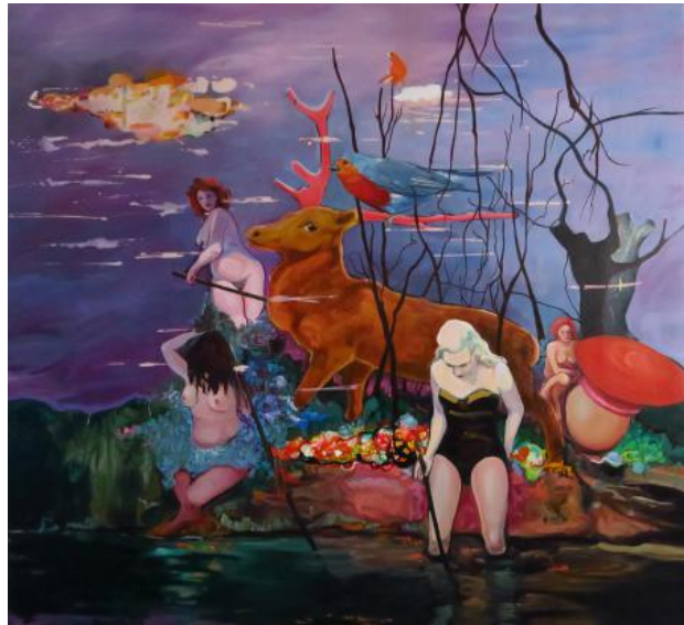
the fellow travellers, 2021 olieverf en acrylverf op canvas, 200 cm x 190 cm