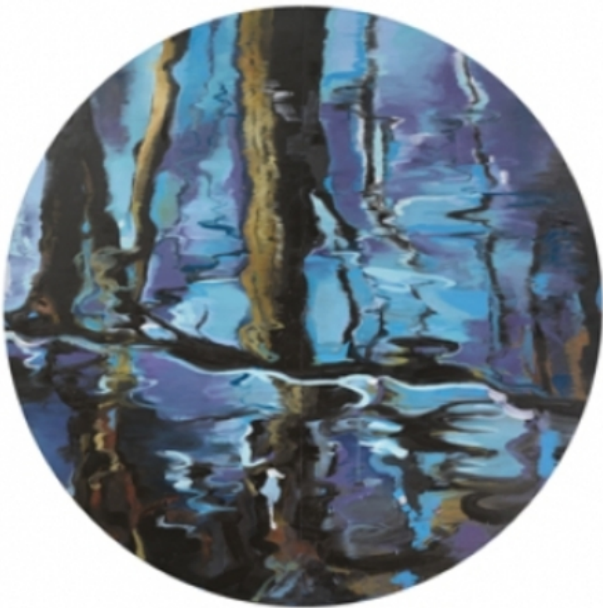
de beek, 2007 olieverf op linnen, 240 x 240