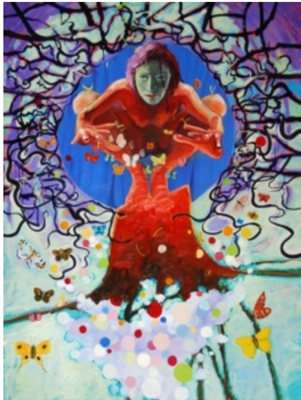
het vlindermeisje, 2010 olieverf op linnen, 160 x 120