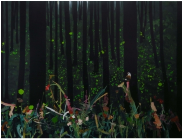
nychthemeron 13 the deeper I go the dark, 2018 olieverf op linnen, 160 x 120