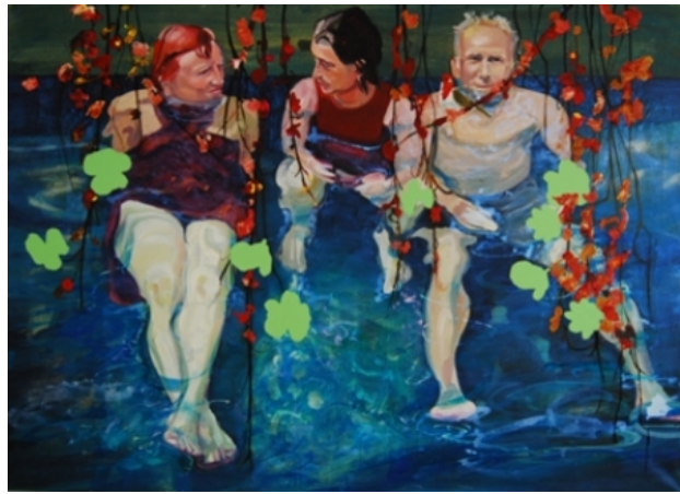
het gesprek, 2015 olieverf op linnen, 190 x 130