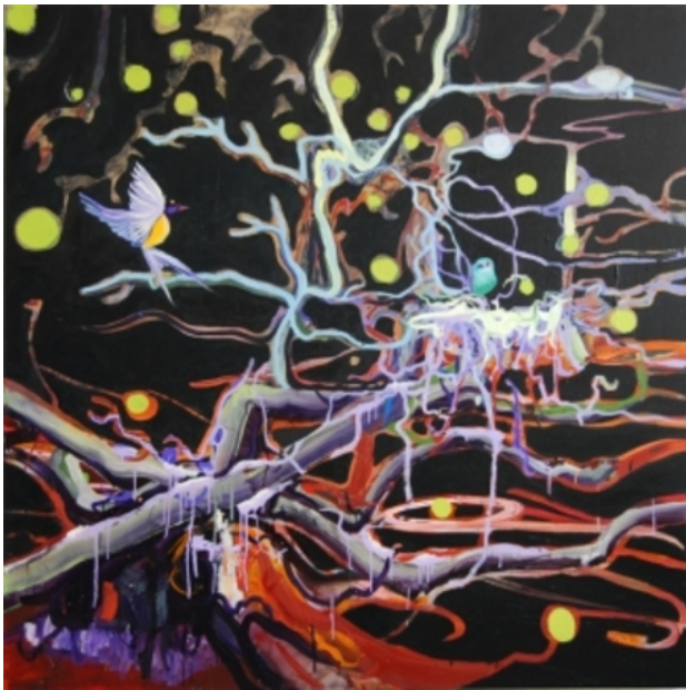
aanvliëgend in het donker, 2010 olieverf op linnen, 140 x 140