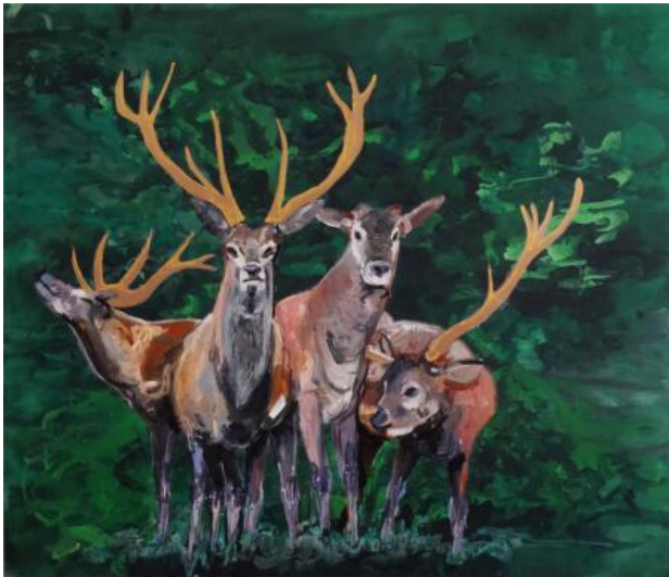
dain,dvalin,duney en durathor, 2025 olieverf, acrylverf, acrylinkt op canvas, 200 x 160