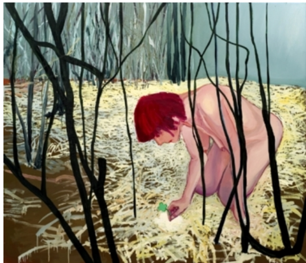
het sprookje van het geluksmeisje en het, 2007 olieverf op linnen, 150 cm x 130 cm