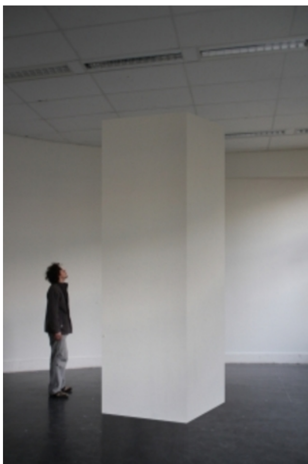
Sequence, 2014 polystyreen, 370cm. x 125cm. x 125cm.