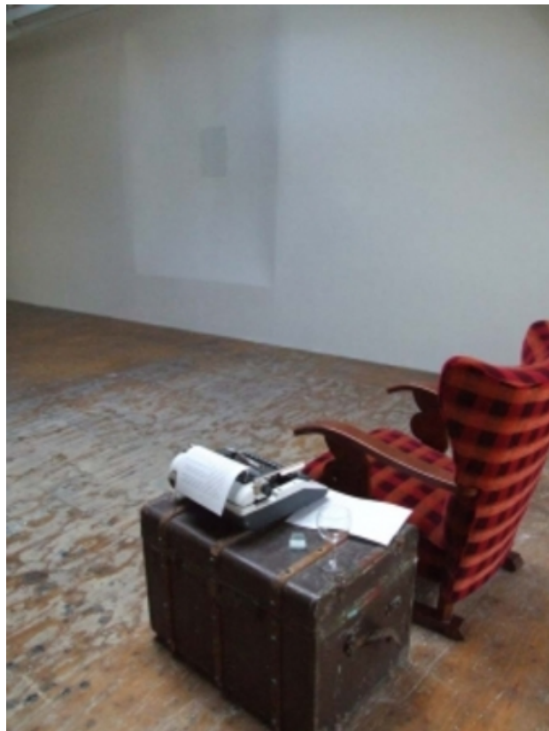
Luisteren naar je gedachten, 2011 verschillende materialen, ruimte vullend