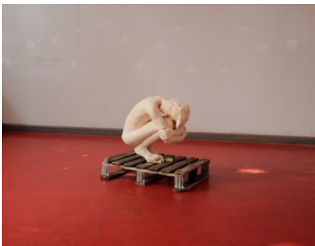
geen titel, 2014 keramiek, 70cm. x 65cm. x 50cm.