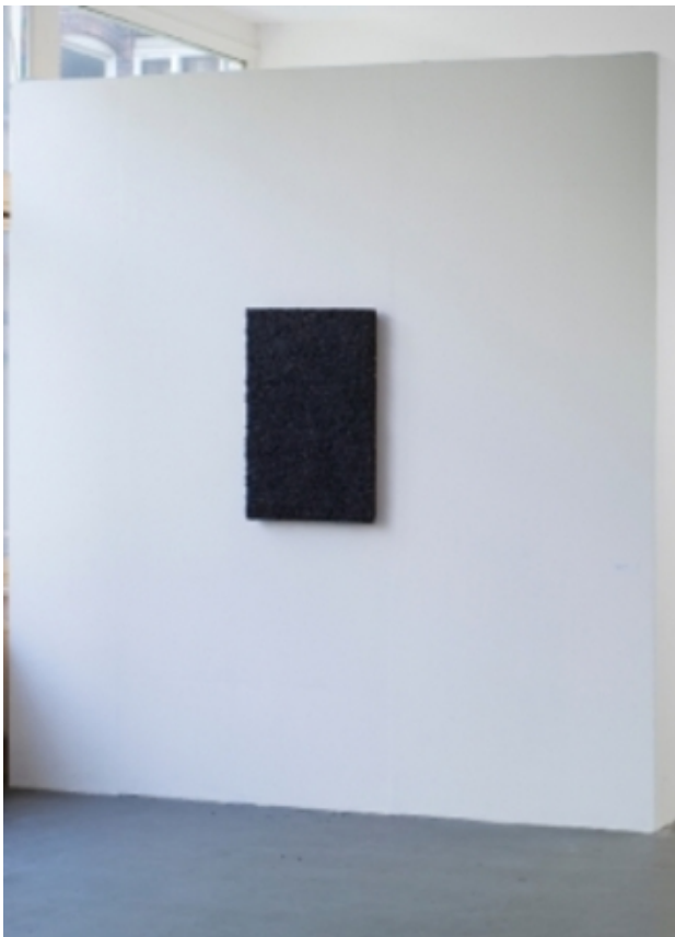
Bitumen, 2012 Asfalt, 85cm. x 56cm.