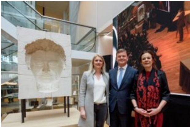
Rosalind Franklin, 2017 gips, 100 x 100 x 250