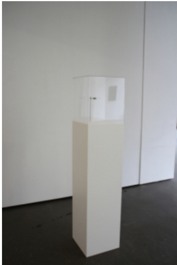
Museumkever, 2012 gemengde techniek, 162cm. x 36cm. x 36cm.