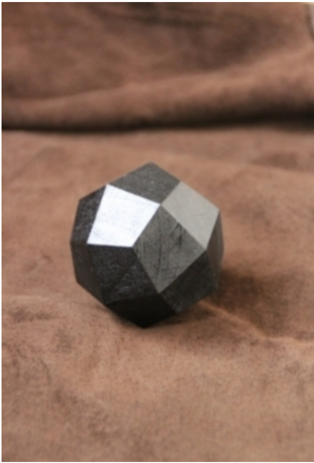
Deltoidalicositetrahedron, 2013 hout, 5cm.