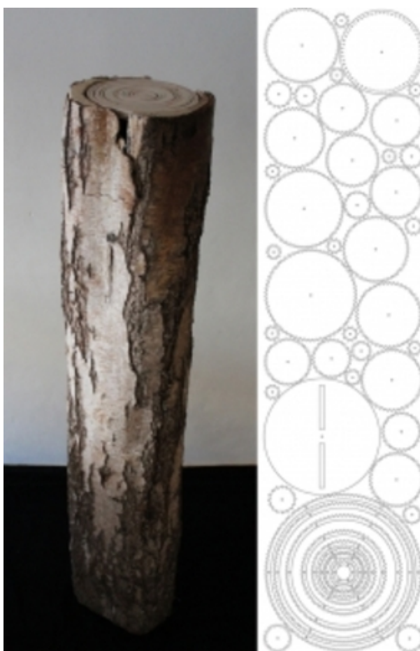
clockwise nature, 2013 gemengde technieken, 170cm. x 29cm.