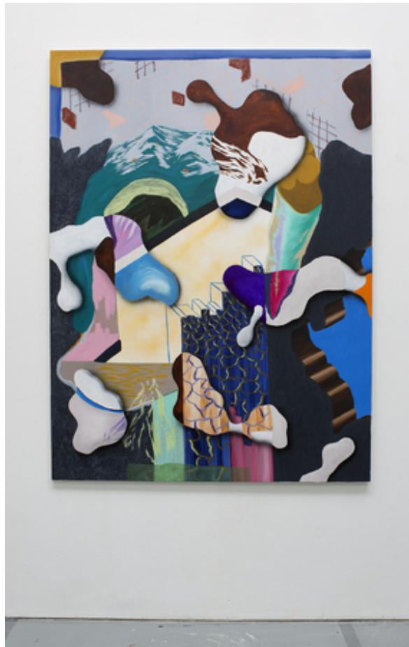
First we did molly, , 2018 Oil and acrylics on canvas, 115 x 160 cm