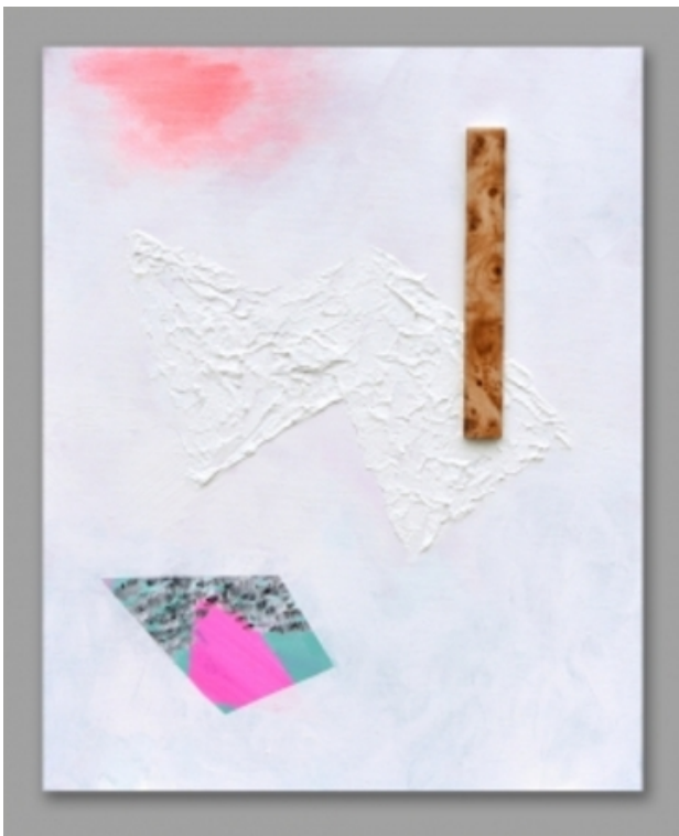
Why does it look so good but feel so bad, 2016 marble tile and acrylics on canvas, 40x50