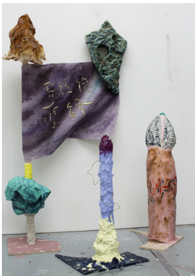
You're a fuckin' inanimate object! , 2019 Polystyrene, plaster, paper maché, latex rubber, cotton, acrylics, resin and wood, variabel