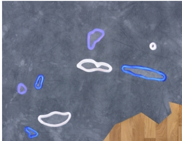
MTFBWY, 2016 oil and vinyl on pre-dyed canvas, 130x170 cm