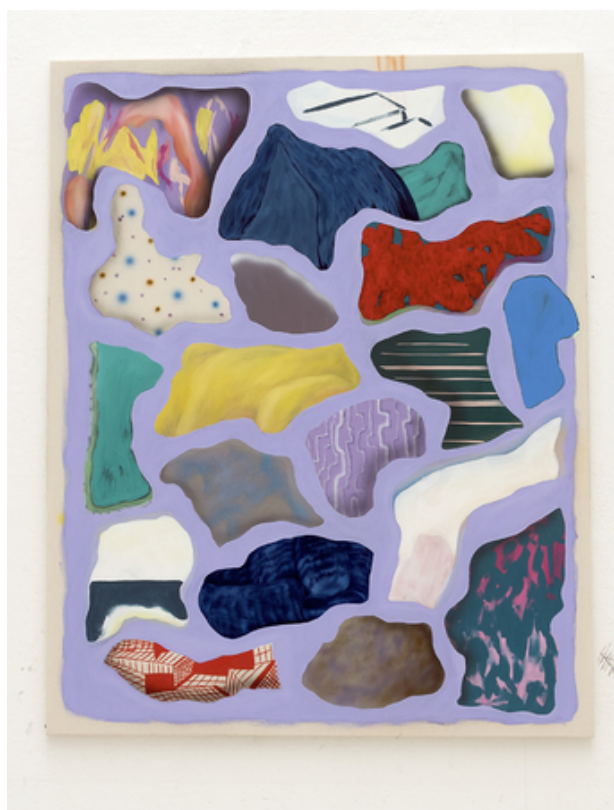
Play Doh's Cave, 2018 Oil and acrylics on canvas, 100 x 130 cm