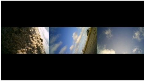
Memory Studies, 2017 performance, video