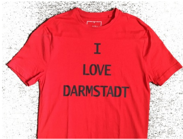
Darmstadt Hugging Music, 2016 performance