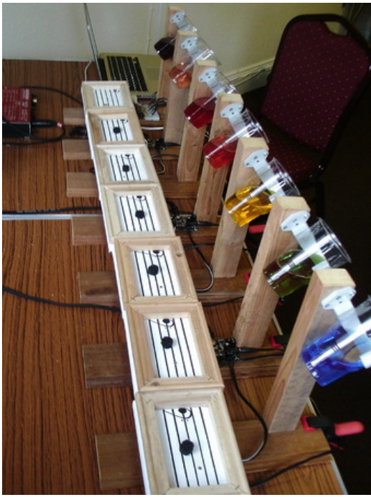
KlangfarbenTanz, 2018 performance, installation