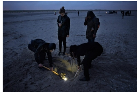
Sand Songs, 2016 Installatie