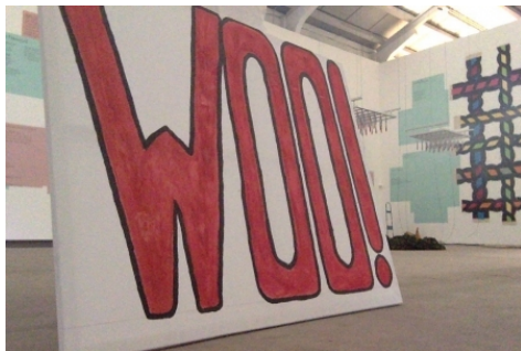
A Hard Day's Night, 2016 performance