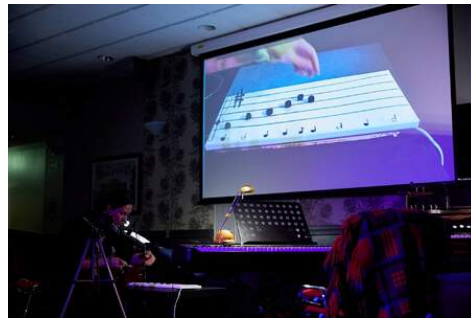
All English Music is Greensleeves - solo, 2018 Performance