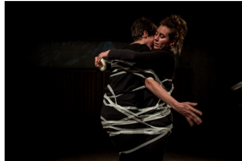
Tape Piece, 2017 performance