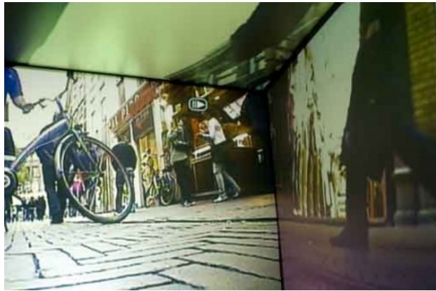
'STAP', 2009 video installatie/ omgeving