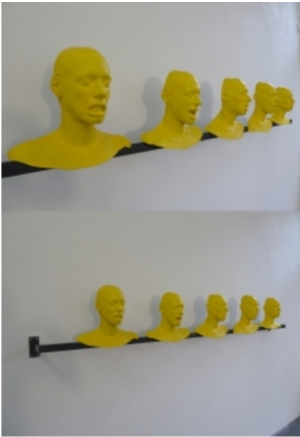
Yellow, 2012 life-casting, gips, epoxy, 300