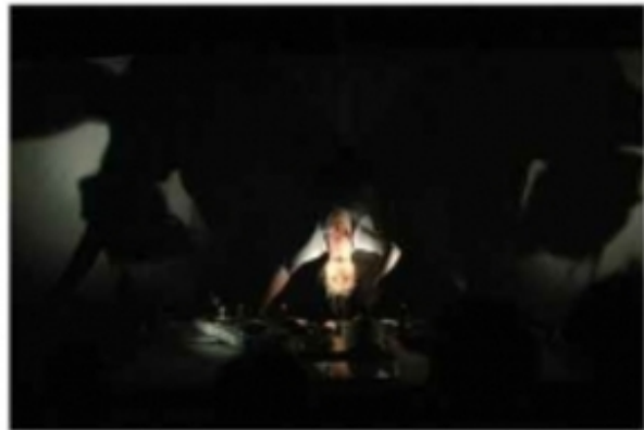
'Hysterie', 2008, Nieta Koek