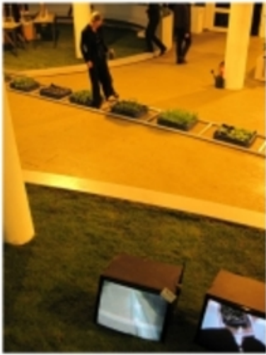
'Waterschade of de drielingzenuw', 2010 performance