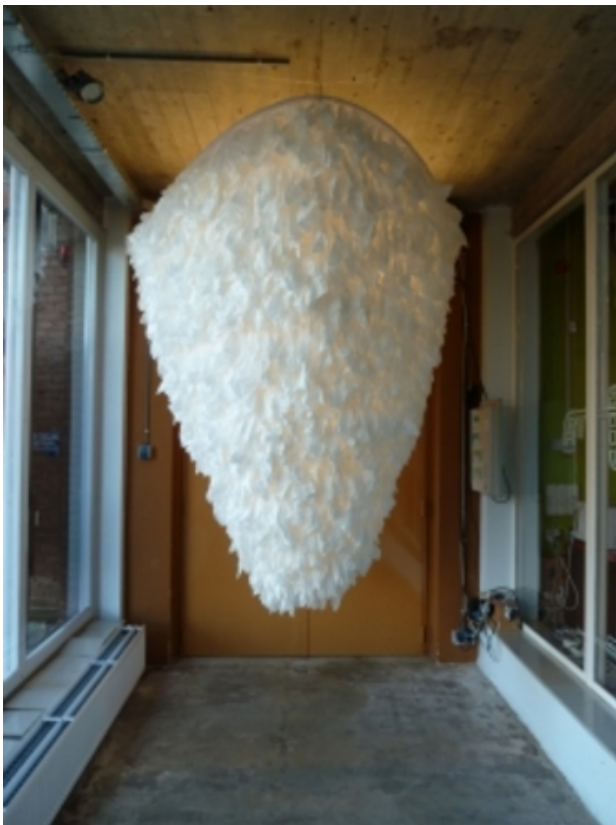
paper tissue dress, 2011 katoen, papieren tissues