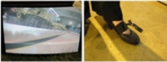
'Doorlopend', De tuin der lusten 2008, Nieta Koek