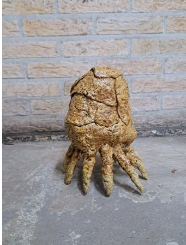
Monstrosis, 2025 Stoneware unique glaze, 25 x15 x 15 cm