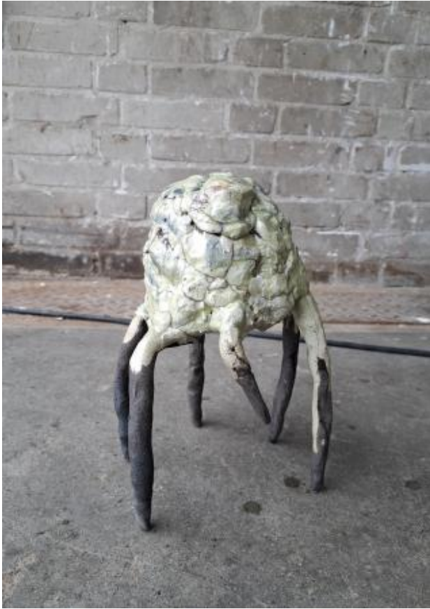
Monstrosis, 2025 Raku unique glaze, 27 x 20 x 20 cm