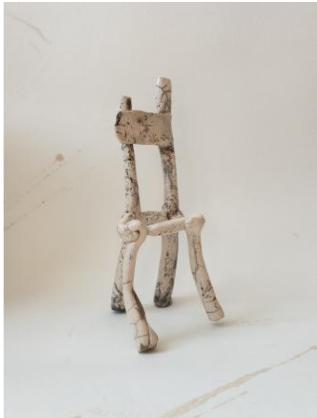
RakuChair, 2024 Raku , 20 x 8 x 7 cm