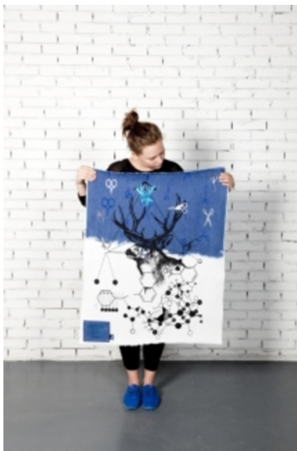
Denim days / sleepless nights, 2014