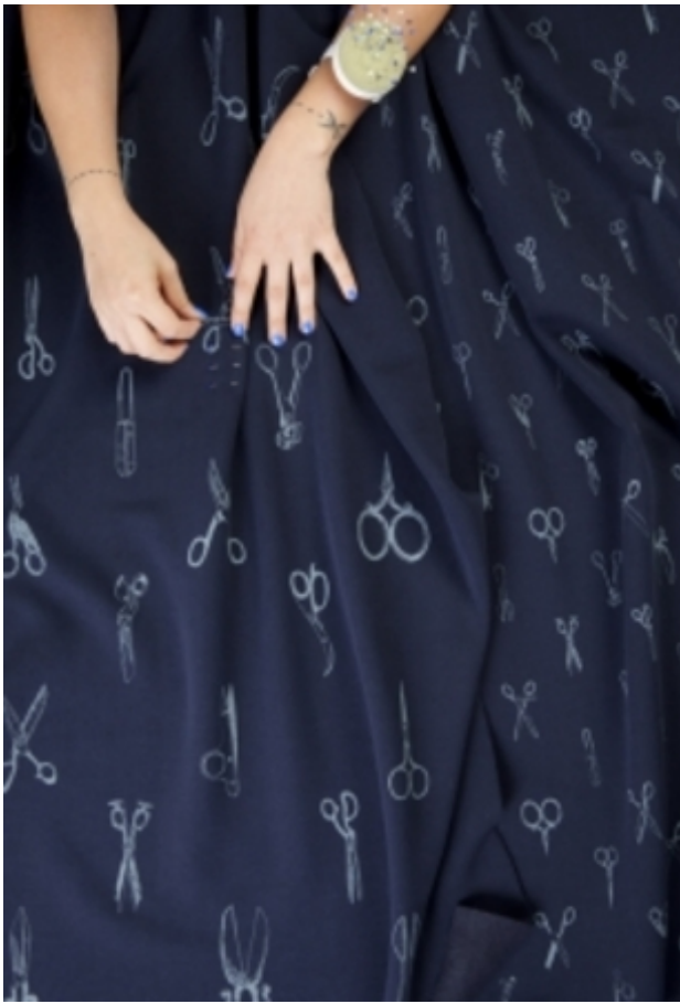
Denim days / Sleepless nights, 2014 zeefdruk op textiel, 80 cm x 100 cm