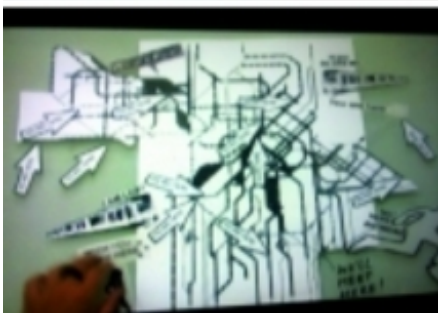
SUBways 'Film', 2011 film / mixed media, 4:08 minuten