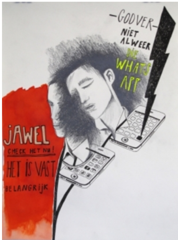
Generation Overload; WhatsApp, 2012 ecoline, marker, fineliner, potlood, 29,7 x 21