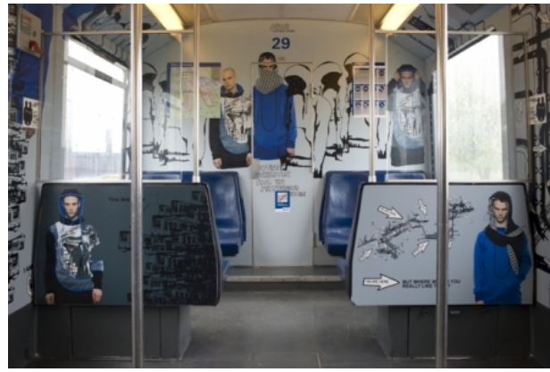
SUBways 'Metro', 2010 mixed media, metrowagon