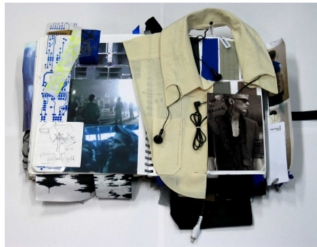
Codex Memoria schetsboek 'Film', 2008 collage technieken, boek: 29,7 x 21 Film: 1:55 minuten