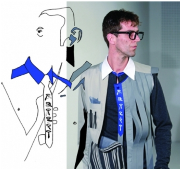
Codex Memoria, 2008 genaaid en zeefdruk, -