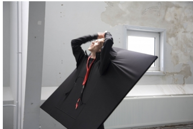
Work of Art Series, 2009 genaaid; textiel op canvas, 120 x 120 cm