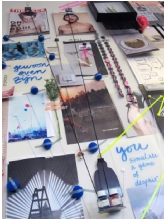
TAKE IT TO THE WALL, 2013 collage technieken, 2m x 2m