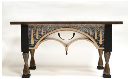
Walvistraan, 2025 Amelander beddebankje van drijfhout, vuren, gestoomd beuken, krijt, beender- en huidenlijm, caseïne, aangespoelde steenkool, walvisbot uit de Amelander walvisvaart, vernis en lak, 88x34x46 cm.