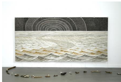
De Waddenzee, 2025 caseïne met pigmenten van materialen uit het Waddengebied, zeewater van verschillende plekken in verschillende staten, schedels en botten, drijfhout, 210x440 en variabele vloedlijn