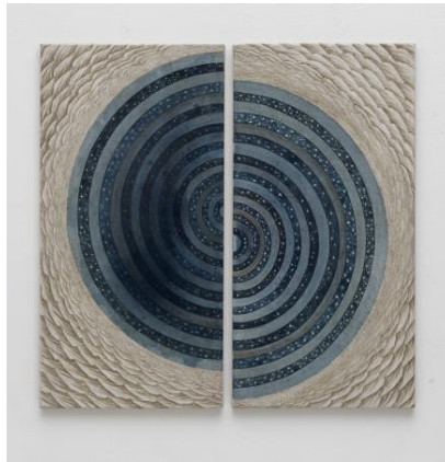
Ze hebben daar de Waddendijk doorgebroken, 2023 caseïne met pigment van vissenwervels, zeewater en gesso op doek., 80x82 cm.