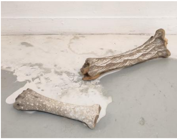
Vloedlijn (detail), 2024 aangespoelde botten, caseïne met pigment van fossiele botten, Noordzeezandpigment