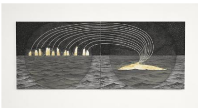
De walvissen komen de botten van hun voorouders halen, 2024 caseïne, aangespoelde steenkool, walvisbot, zeewater en gesso op doek, 200x80