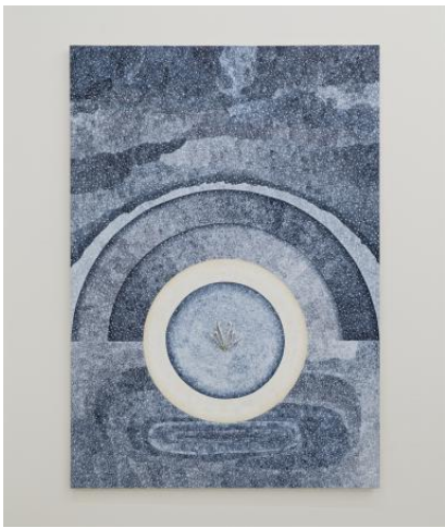
Het universum buigt om de stervende vogels, 2024 caseïne, zeewater, walvisbotpigment, snavels op doek, 200x140 cm.