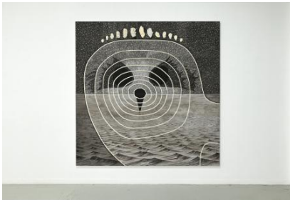
OERD / De velduilen zullen uit de as herrijzen, 2026 Japanse oesters, aangespoelde steenkool en plastic draadjes, suppletiezand, zeewater, contourlijnen van de bodemdaling door gaswinning, caseïne en gesso op doek, 220x220 cm.