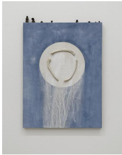
Cyclus van een zeehond, 2024 Waddenzeewater, Noordzeezand pigment, caseïne, gegraveerde zeehondenribben, vissenwervels op doek, 80x60 cm.