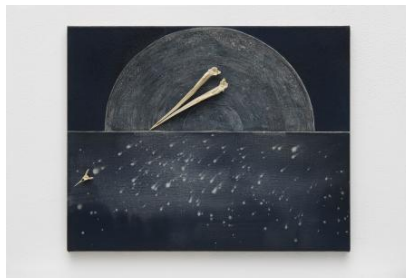
Waar de dieren heengaan om te sterven (Jan van Gent), 2023 caseïne met pigment van platte oester, zeewater, Janva Gent snavel, vissenwervels en gesso op doek., 40x50 cm.