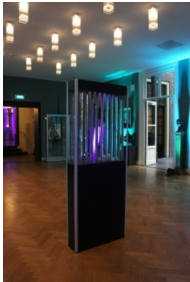
Translucent, 2017 spiegels, aluminium, mdf, 192 x 74 x 22

The Bubble Drum, 2017 Perspex, gekleurd water, geperste lucht, 300 x 300 x 270