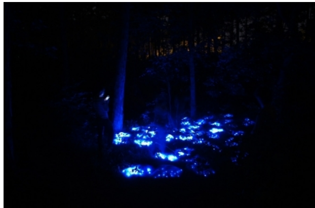
Forest Sparkle, 2014 diverse, 1000 x 700