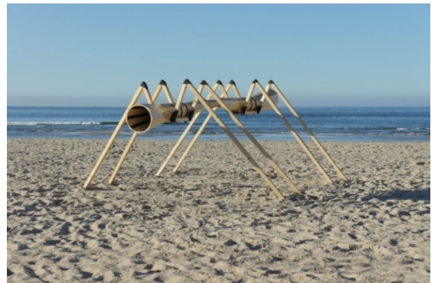
Sea Spider, 2012 hout, vlieger, 450 x 250 x 150