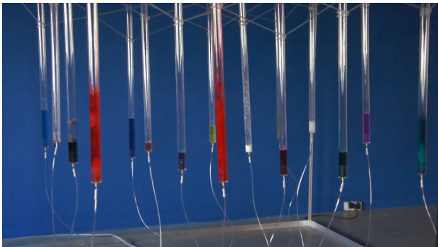
The Bubble Drum