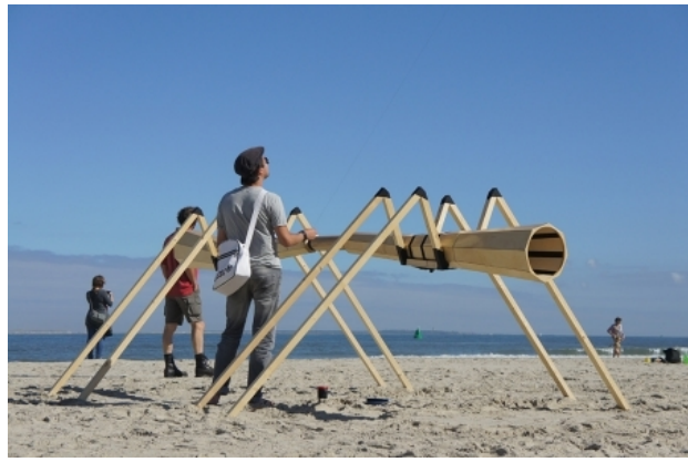
Sea Spider, 2012 hout, vlieger, 450 x 250 x 150