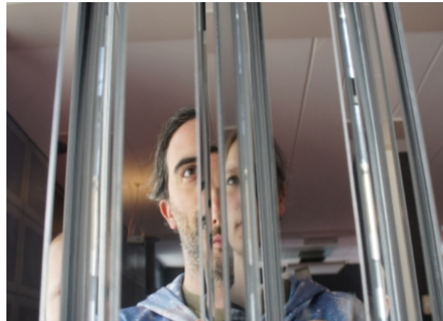
Translucent, 2017 spiegels, aluminium, mdf, 192 x 74 x 22

The Bubble Drum, 2017 Perspex, gekleurd water, geperste lucht, 300 x 300 x 270