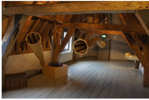
Gramo's Attic, 2014 diverse, 700 x 500