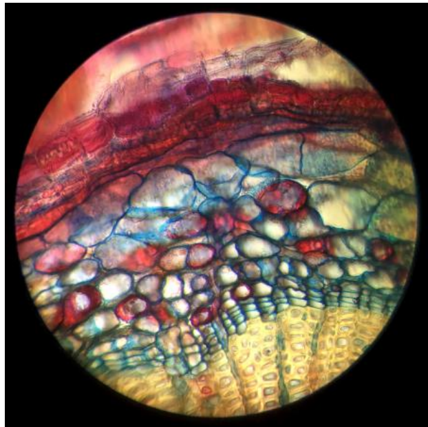
BOTANISCHE MICROSCOPIE - Wortel van de taxus, 2025 Zelfgemaakt microscopie preparaat (coupe). Gefotografeerd door de microscoop. Met iPhone., n.v.t.