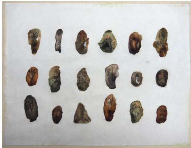
ABOUT FUNGI - Ondergronds I, 2025 Pentekeningen en schildering met verschillende botanische inkten uit Meijndel op Japans kozo papier, 45 x 35 cm