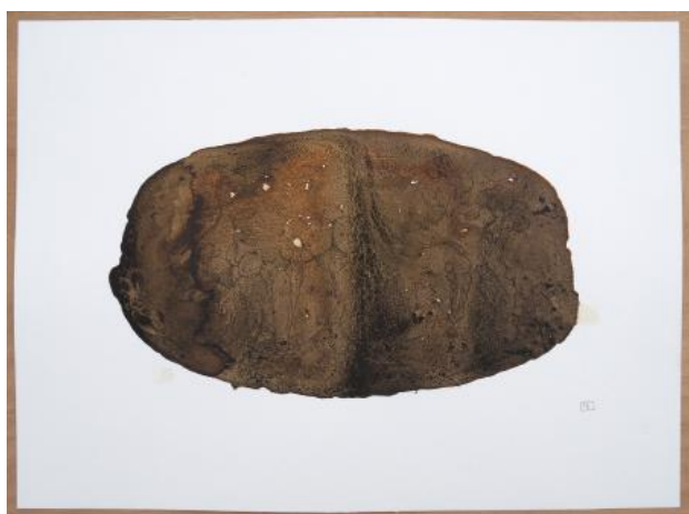
ABOUT FUNGI - Ondergronds IV, 2026 inkttekening overgoten met botanische inkten, 60 x 45 cm