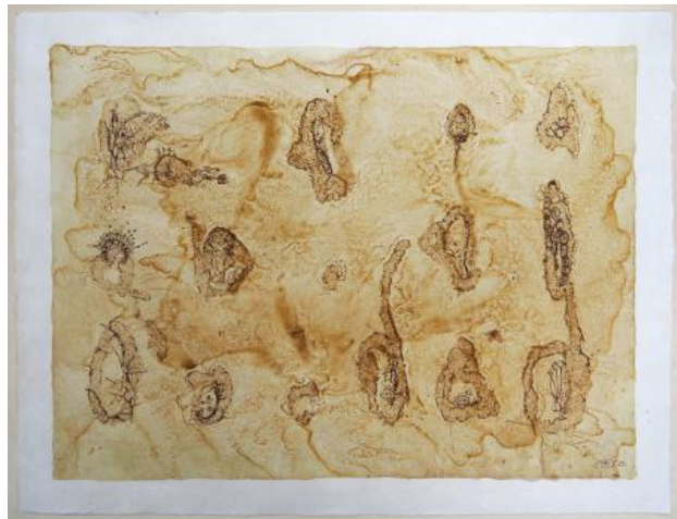
ABOUT FUNGI Ondergronds II, 2025 Pentekeningen en schildering met botanische inkt van de guldenroede uit Meijndel, op Japans kozo papier., 45 x 35 cm