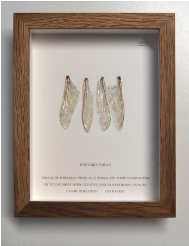
PORTABLE WINGS, 2025 Herbariumkunst, 15 x 19 cm