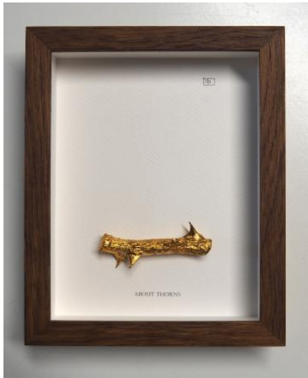
ABOUT THORNS, 2025 Herbariumkunst, 15 x 19 cm