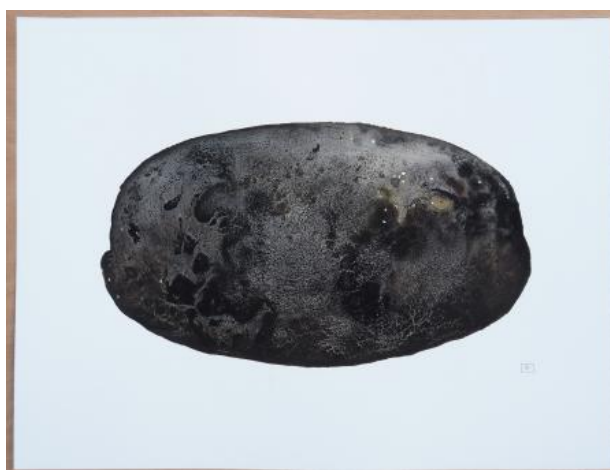
ABOUT FUNGI: Ondergronds V, 2026 Inkttekening, overgoten met botanische inkten, 60 x 45 cm