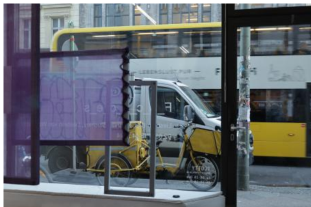
F.A.C.A.D.E.S., 2024 Installation , 150x150x100cm