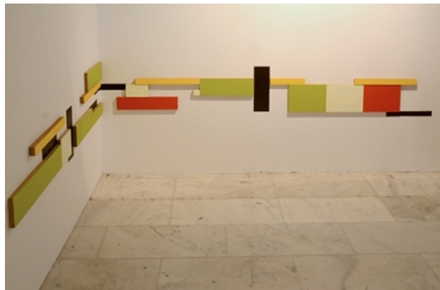
fantastic facts, 2016 installatie, 50 x 450 cm