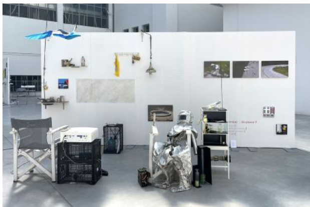
remember dis-displace, 2024 installatie, nvt