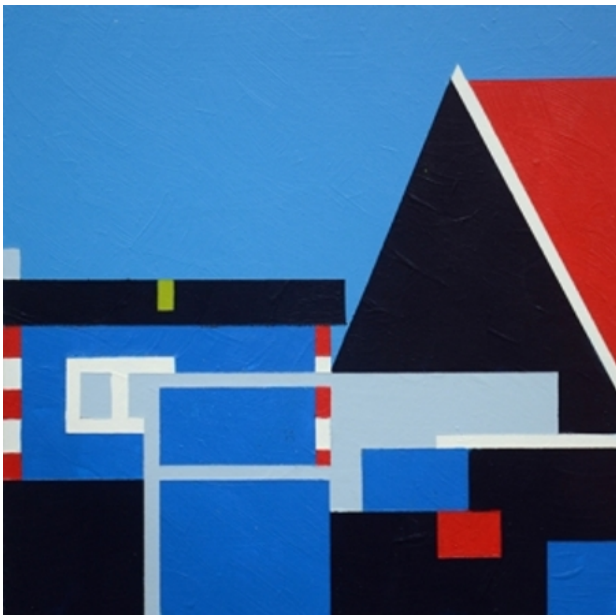
en zijn meerdere wegen 2.0, 2017 acryl op paneel, 20 x 20 cm