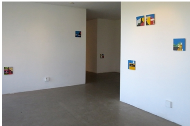
in straten, onder dieren, 2017 installatie