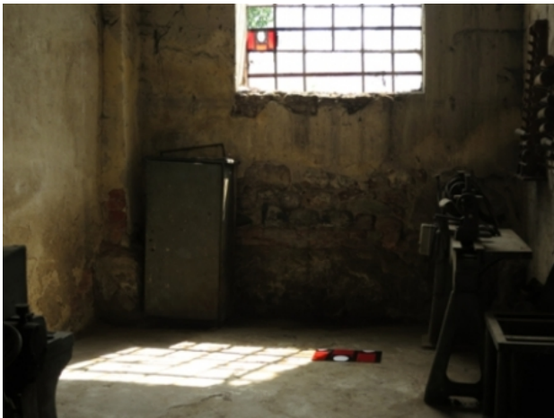
healing injuries, 2014 installatie