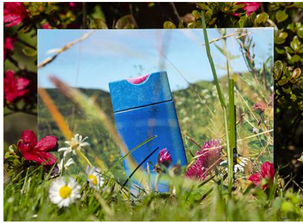
essential elements, 2020 foto, 30x45 cm