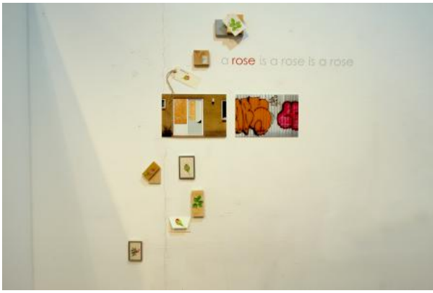
A rose is a rose ..., 2023 Installation , 120x150cm