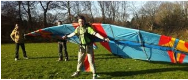
Human Birdwings, 2012 Online, 2014