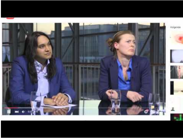
The Modular Body, 2015 1:00