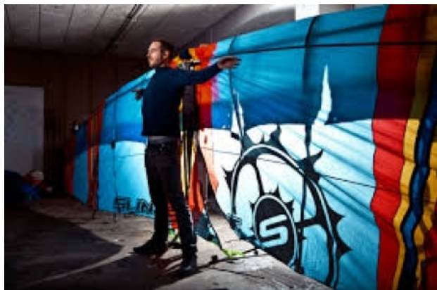
Human Birdwings, 2012 Online, 2014