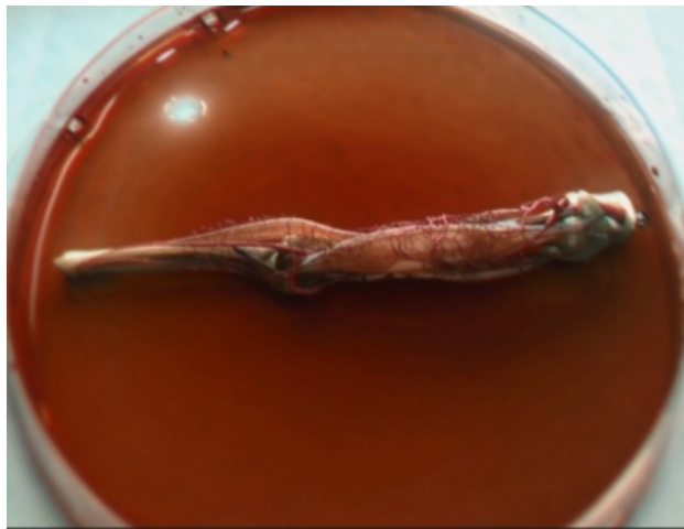
The Modular Body, 2015 Animatie, 2013