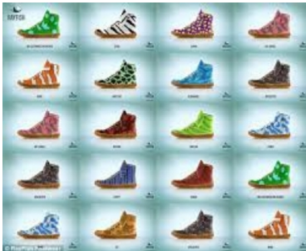
Rayfish Footwear, 2021 Online