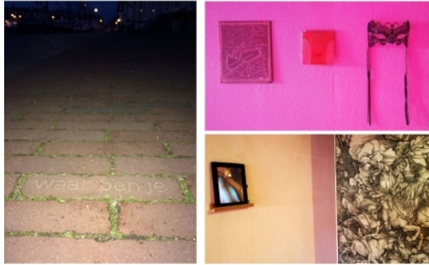
Waar ben je, 2014 Ruimtelijke collage, en ingrepen openbar