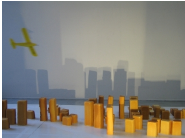
Cakestad 8:44, 2012 Cake, Las Vegas grid op plateau, vliegtu, 4X4 M