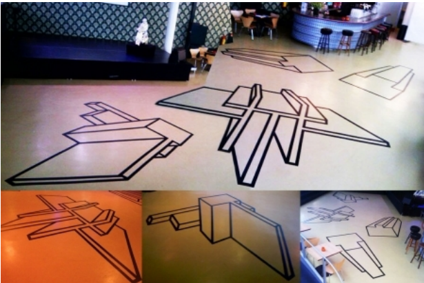
Atmosferisch perspectief, 2013 Tape op vloer