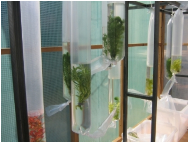
Detail 'Transportaal', 2007 Plastic, planten