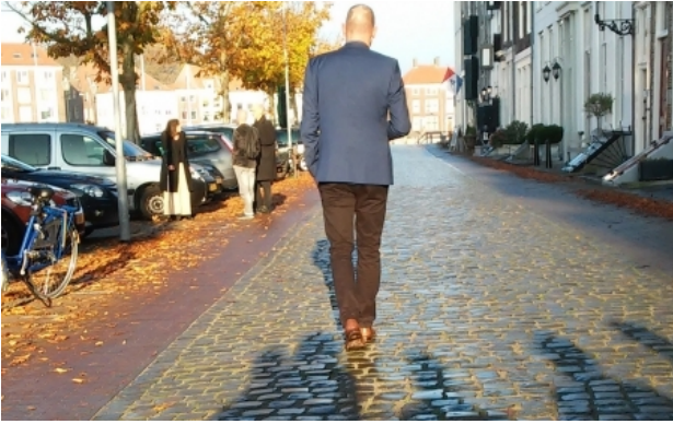
Tonsure Ou es-tu, 2015 Ingreep

1994 - Organisatie en samenstelling kunstenaars 2003 initiatief Keller i.s.m. Adriaanse