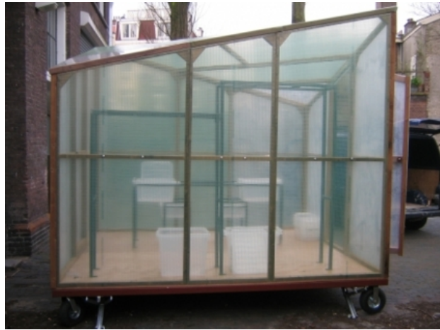
'Transportaal' Mobiele ruimte, 2007 Plastic, hout, wielen, 3X3X2 M