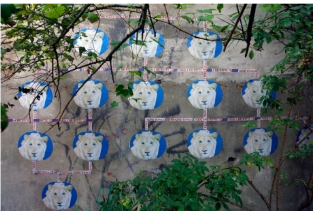
King Tonga, 2010 Collage, 4X5 M