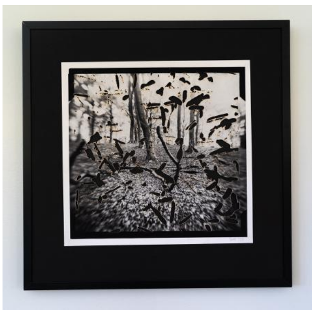
cloudchamber#3, 2023 foto op barietpapier, bewerkt met lasercutter, 30x30 cm