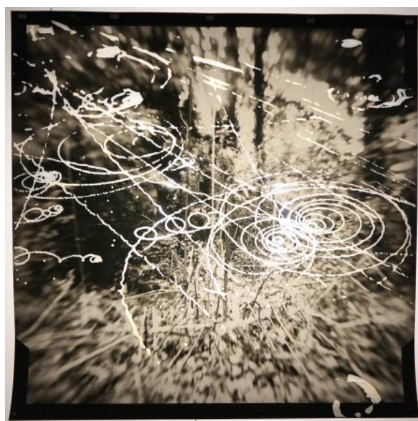
Exposed landscape, 2023 foto op papier met toegevoegde cloudchamber middels lasercutter, neon licht, 80x80 cm