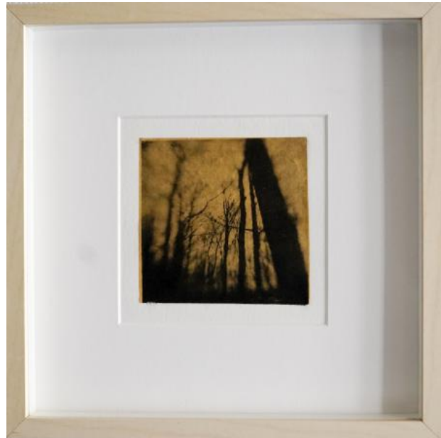
unsettling landscape a, 2021 toyobo/chine colle, 20x20cm