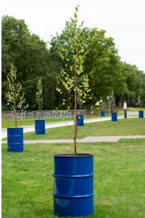
Low Level Legacy, 2025 7.40 min.