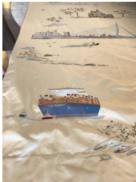
, 2022 machinaal geborduurd zijde