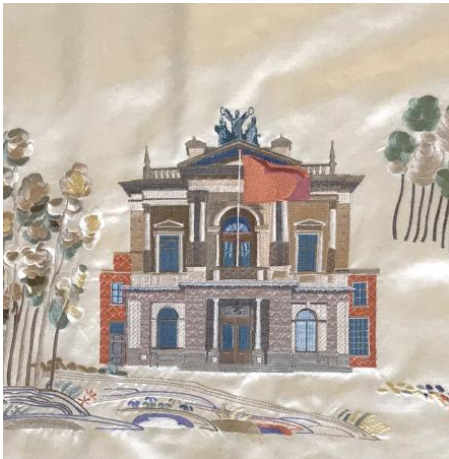
Het Teylers, 2022 machinaalgeborduurd zijde, 40x40cm