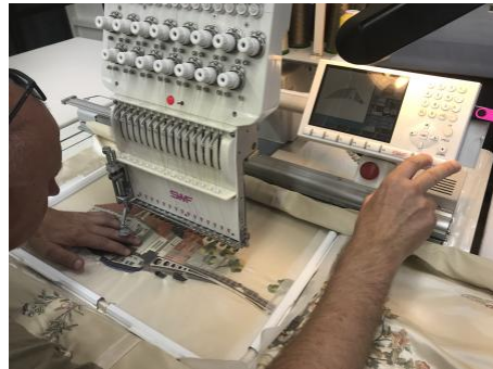
Dokkum, 2022 machinaal borduur