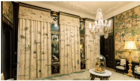
nieuwe gordijnen en situ, 2023