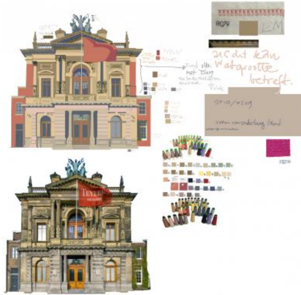
het Teylers, 2022 digitaal