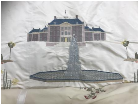
, 2022 machinaal geborduurd zijde