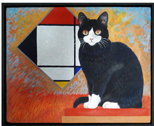
Mondriaan, 2018 eitempera, 24x30 cm