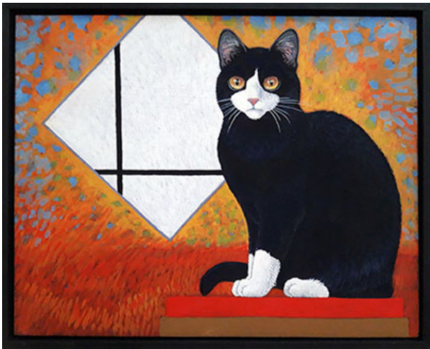
Mondriaan, 2018 eitempera, 24x30 cm