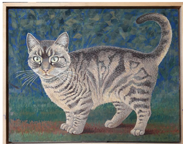
poes met map, 2019 eitempera, 24x30 cm