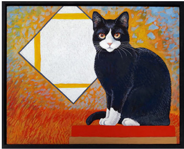
Mondriaan, 2018 eitempera, 24x30 cm