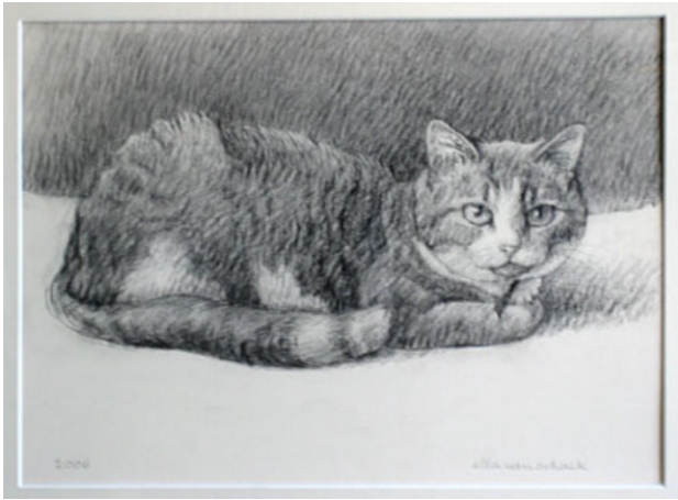
poes tekening, 30 x 45 cm