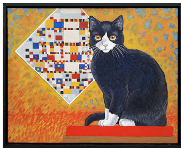
Boogie Woogie, 2018 eitempera, 24x30 cm