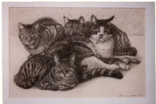
Vier Katten, 1997 Krijt, 30 x 45 cm