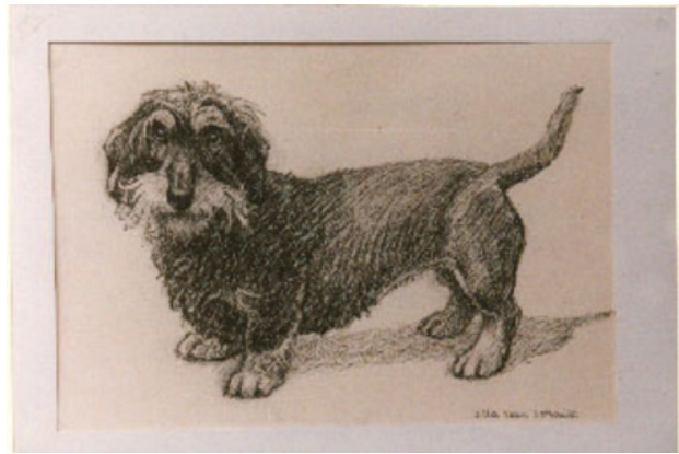
Hond, 1997 Krijt, 25 x 40 cm