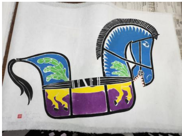
Jaran Keping/Kuda Lumping, 2023 Kleuren Houtsnede op Koreaans Hanji papier, 90x70 cm