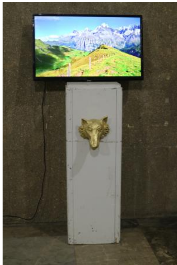
'Let us howl, in praise of Vučko', 2025 video, 150 x 80 x 80 cm