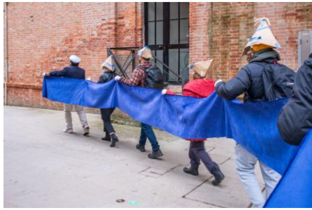
Celestial Salutations', 2024 Costume Performance guided by march music