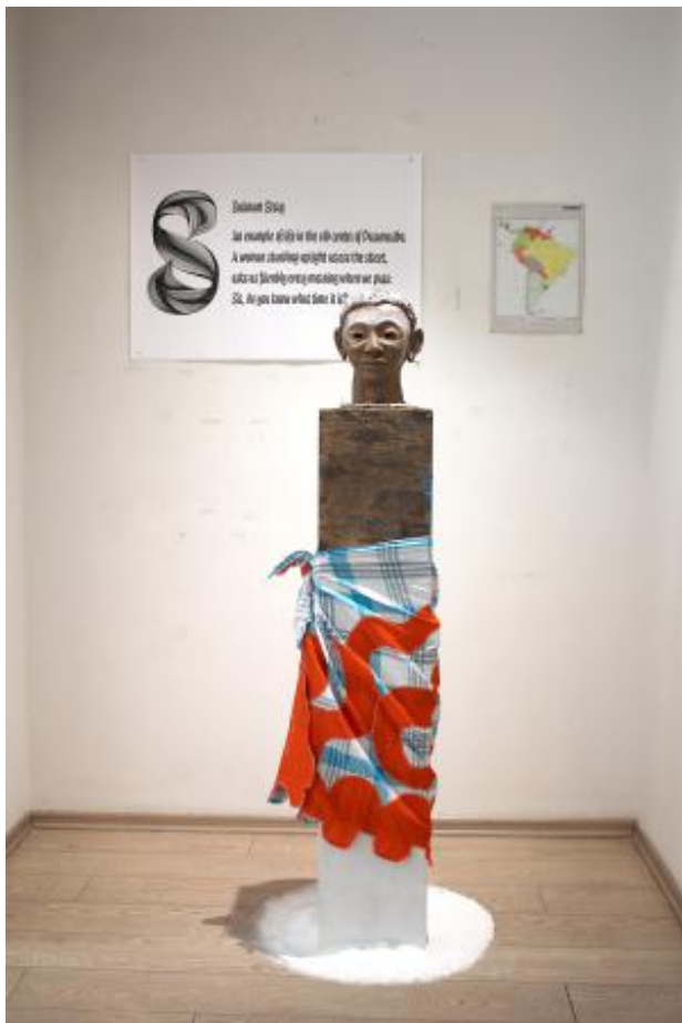
'Women of Loth', 2025 Installation, 300 x 200 x 200 cm