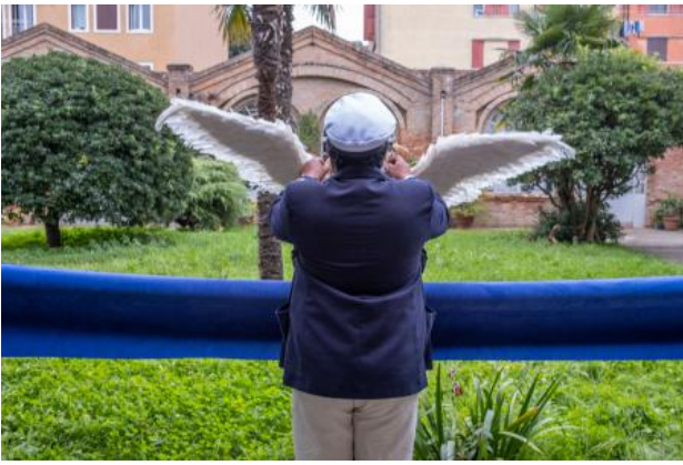
'Celestial Salutations', 2024 Costume Performance