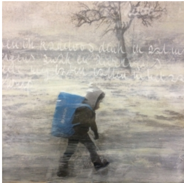
op weg, 2016 olieverf, 80-80