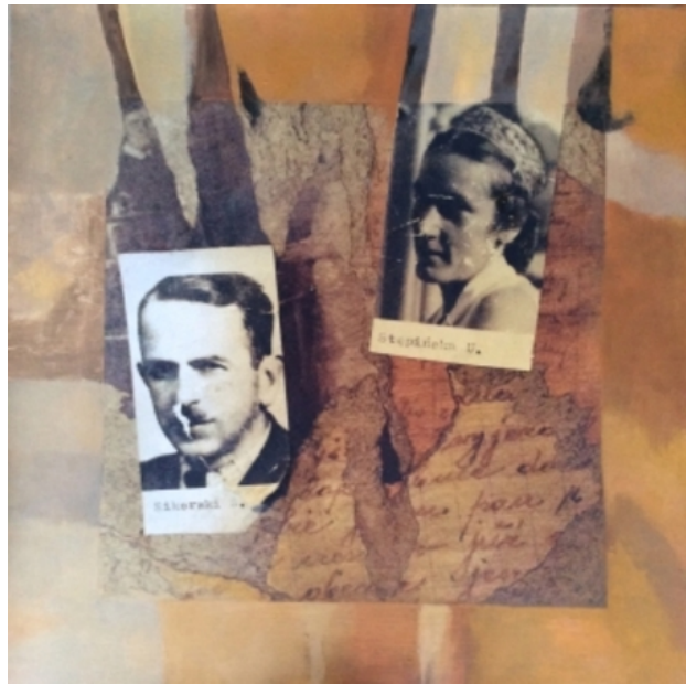
lovers 2, 2014 olieverf mixed media, 70-70