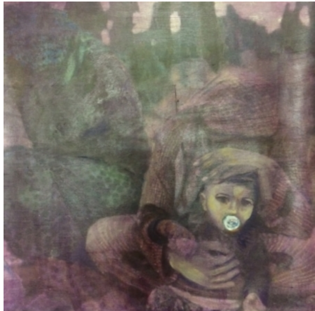
vlucht, 2016 olieverf, 80-80