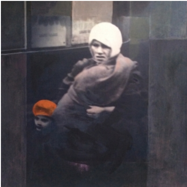
het meisje met de rode baret, 2014 olieverf mixed media, 70-70