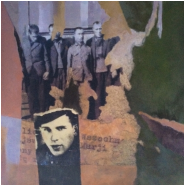
gefangnis, 2014 olieverf mixed media, 70-70