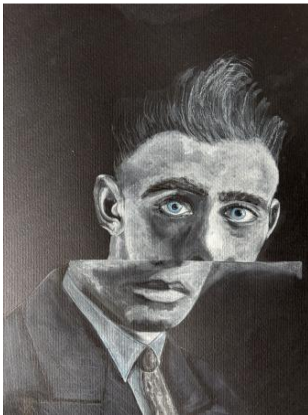
father son, 2025 aquarel, 30x 40