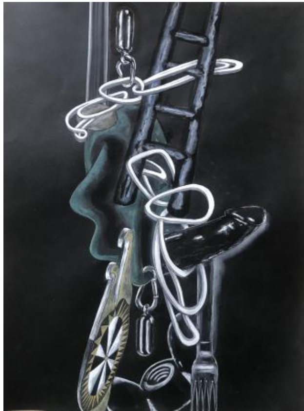
ANN DEIVIE 4, 2024 aquarel, 70x50