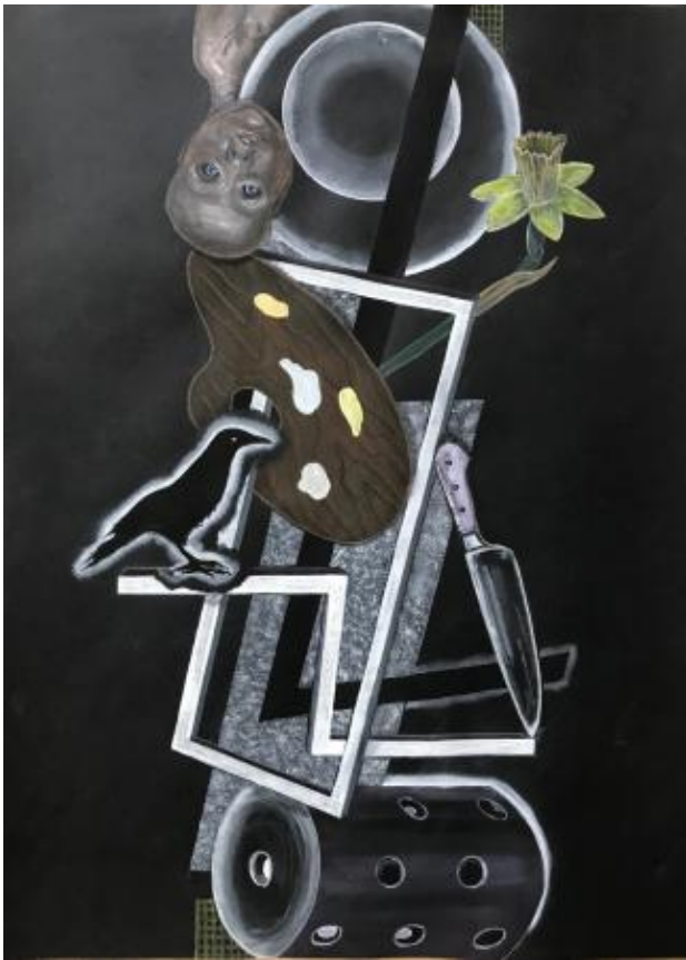
ANN DEIVIE 3, 2024 aquarel, 70x50