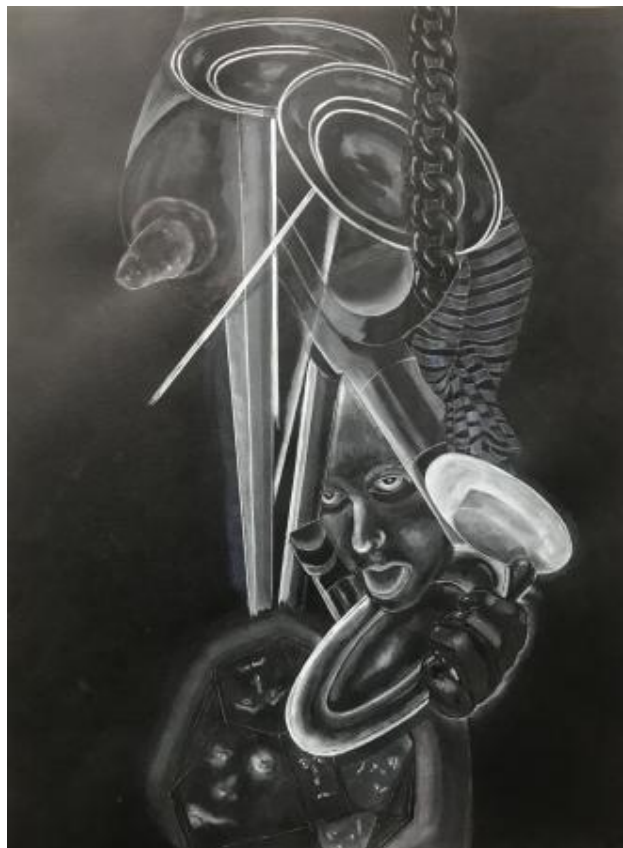
ANN DEIVIE, 2024 aquarel, 70x50