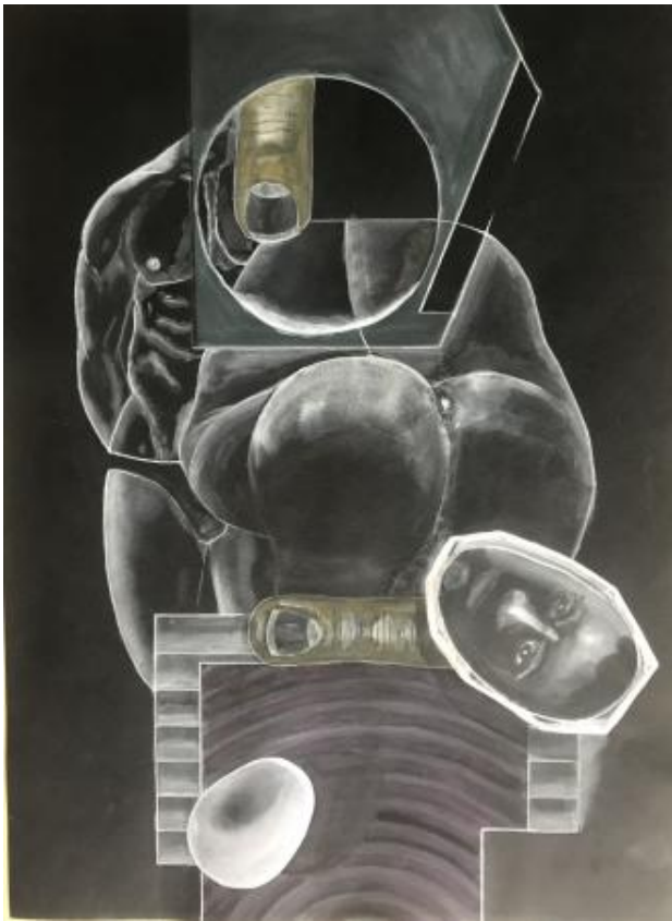
ANN DEIVIE, 2024 aquarel, 70x50