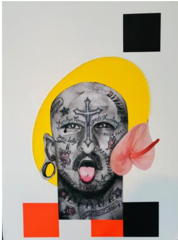
ST. TATOOARIS, 2021 collage schilderen borduren, 100X 75 CM