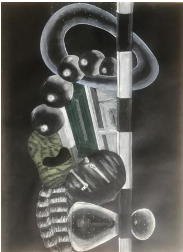
ANN DEIVIE, 2024 AQUAREL, 70x50