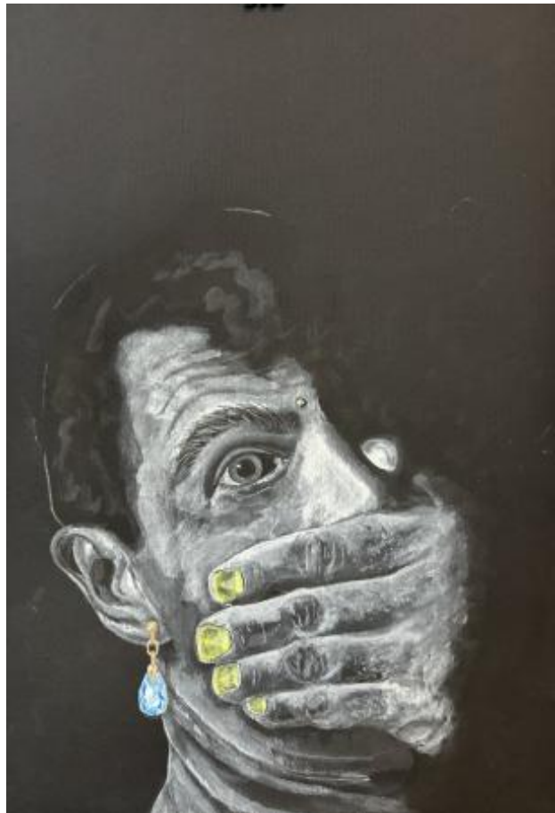
zwart werk, 2025 aquarel, 30x40 cm