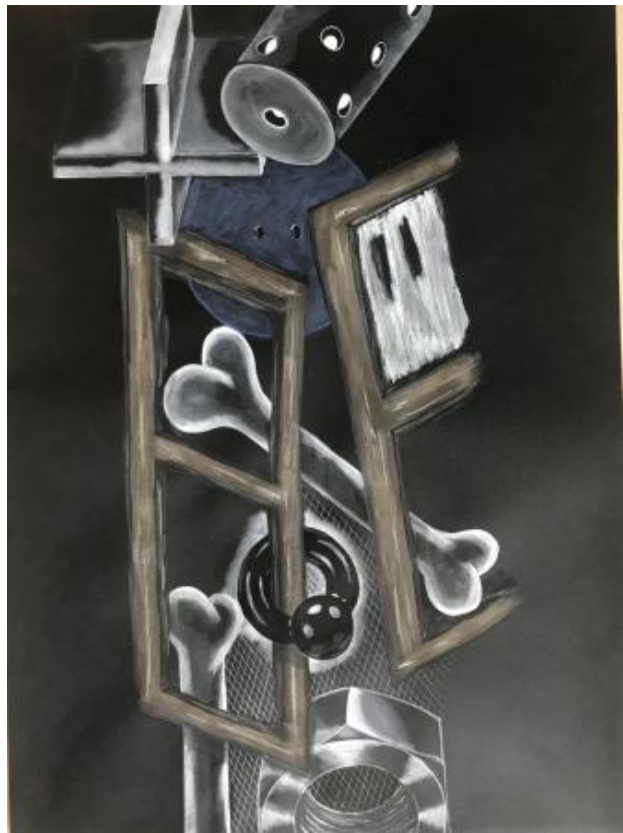
ANN DEIVIE 5, 2024 aquarel, 70x50