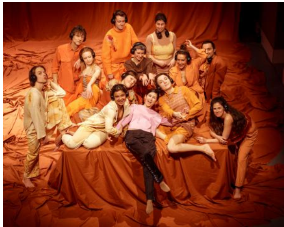
I never want to dance again, 2024 performance, https://vimeo.com/1082821205