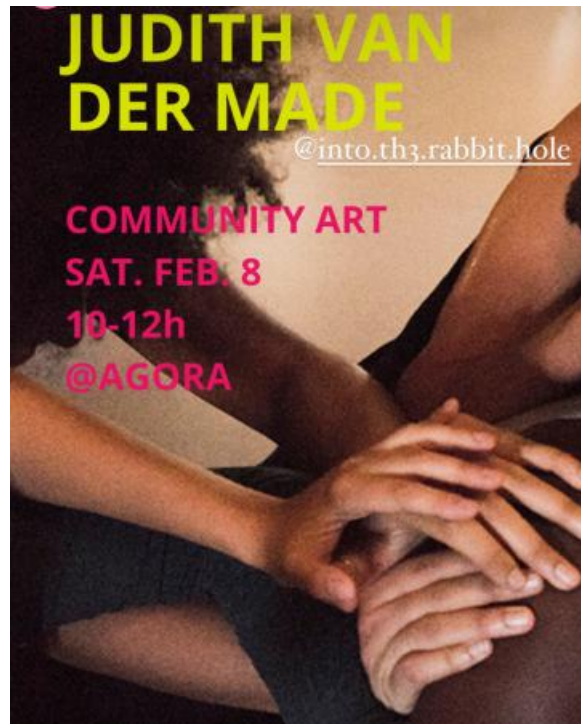
what if we redefine words by experiencing them with our bodies , 2025 community art, https://vimeo.com/1055615662?share=copy