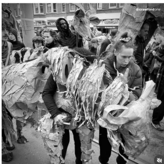
the Herds, 2026 performance / puppets, -