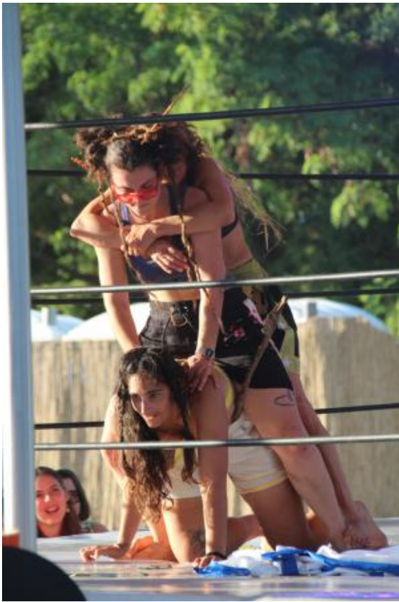
in & uit extase, 2025 voorstelling / performance