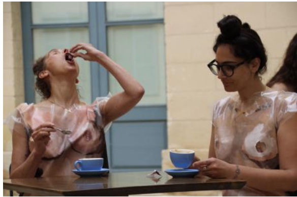
My Body (is)/(not) Your Business Card, 2023 performance, https://vimeo.com/833612647?share=copy