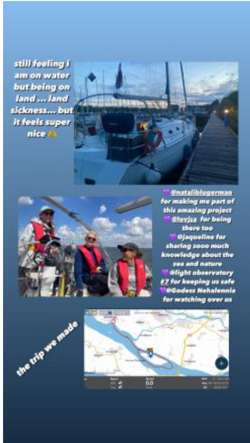
Light Observatory #8, 2023