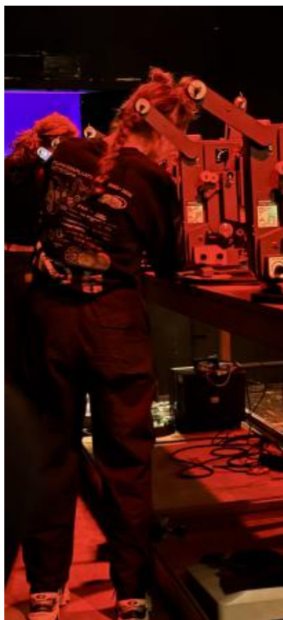
Leaking Lights #2, 2026 16mm film, -