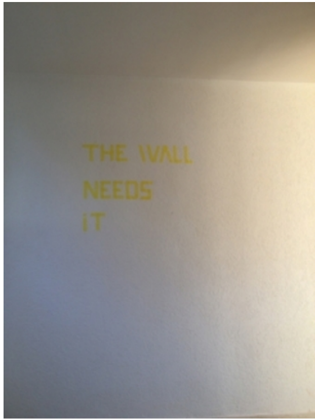
The wall needs it, 2013 tape op muur, naar wens