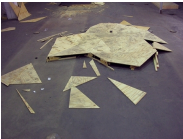
Vloerwerk in opbouw Billytown, 2007 hout, 30m2