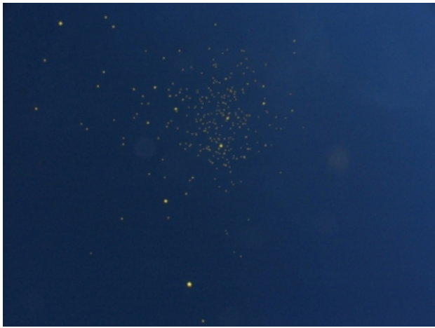
Shattered sun, 2007 bbgun-balletjes, naar wens