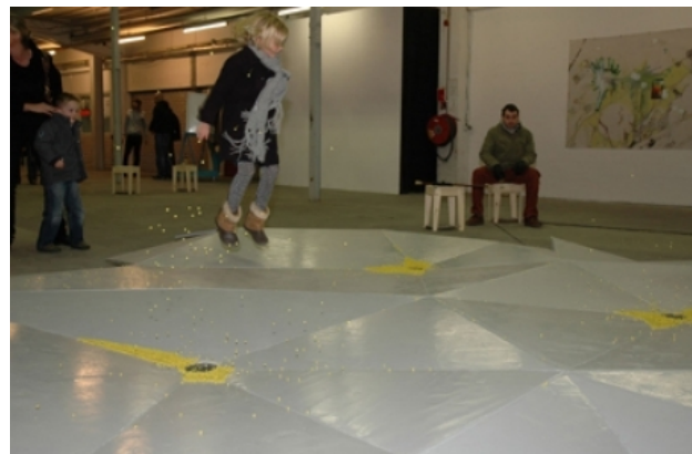
vloerwerk, 2007 kontaktmicrofonen/gele balletjes/hout, 30m2