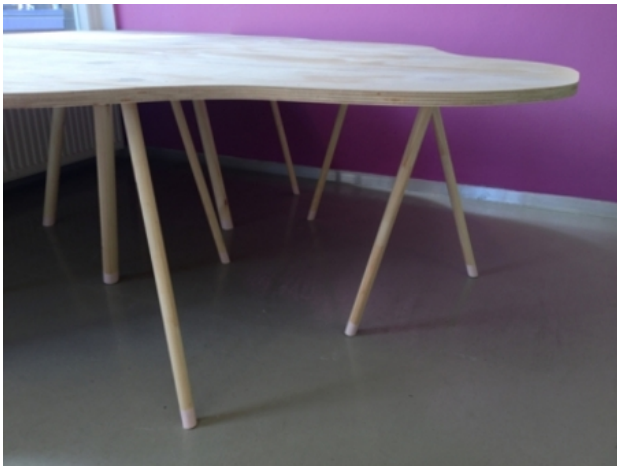
tableau, 2013 hout, 2m-1m