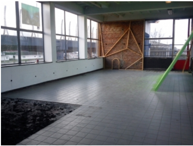
expo Station Noord R'dam, 2011 hout/houtskool/verf, n.v.t.