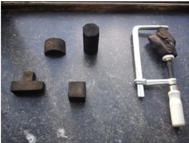
Over Tijd, 2011 verbrand hout/lijmkleem, n.v.t.