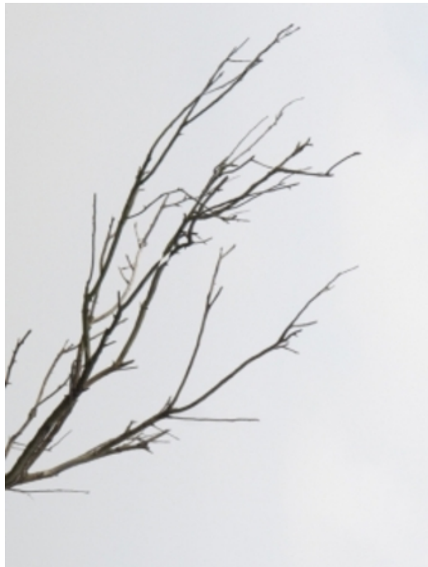
tak-uitsparing, 2011 fotobewerking, naar wens