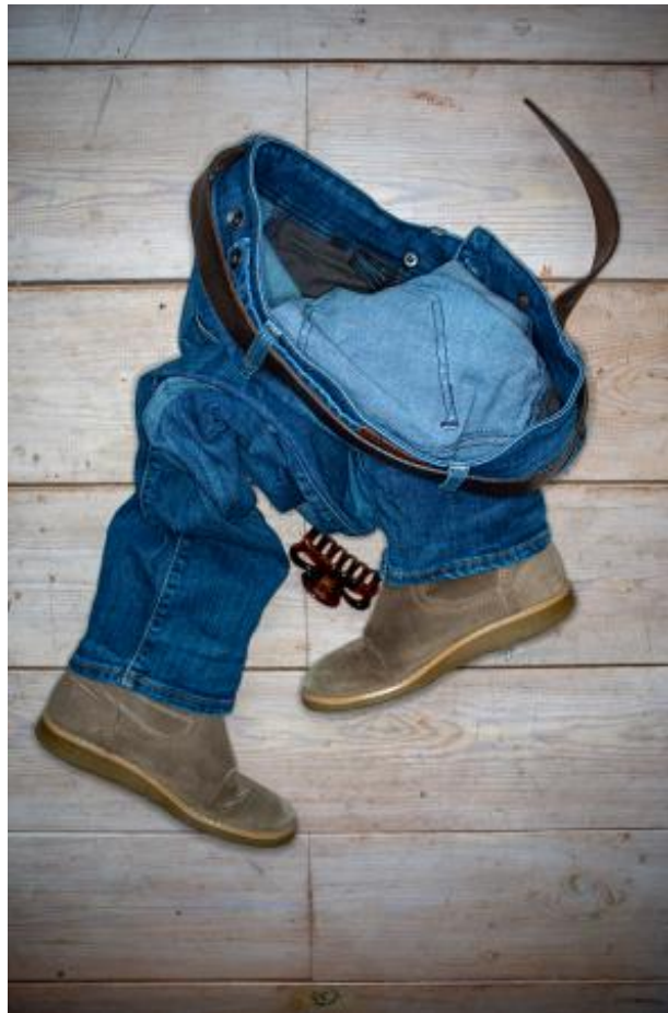
Stilleven, 2021 Fotografie, serie van 5 foto's (vooralsnog), 60 x 90 cm