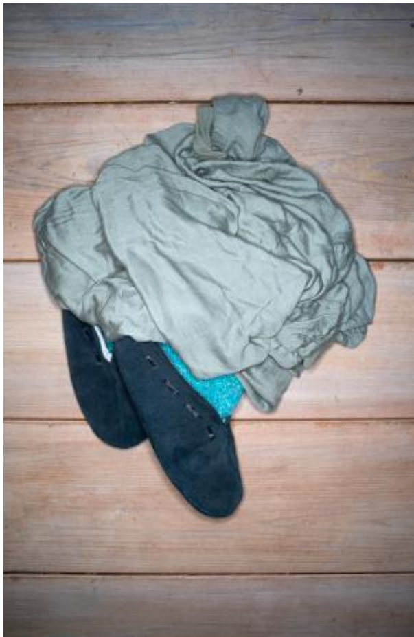
Stilleven, 2021 Fotografie, serie van 5 foto's (vooralsnog), 60 x 90 cm