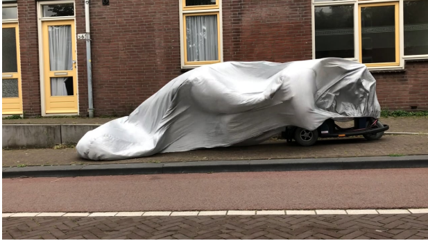
No title, 2021 01:02