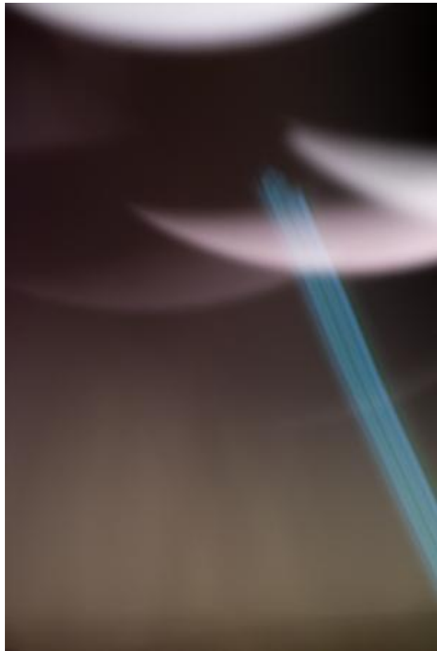
Best Practice (techniek of werkmethode die zich als effectiever heeft bewezen dan enige andere techniek of methode), 2020 Zeefdruk, 38 x 57 cm