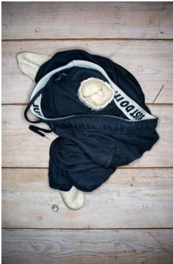
Stilleven, 2021 Fotografie, serie van 5 foto's (vooralsnog), 60 x 90 cm